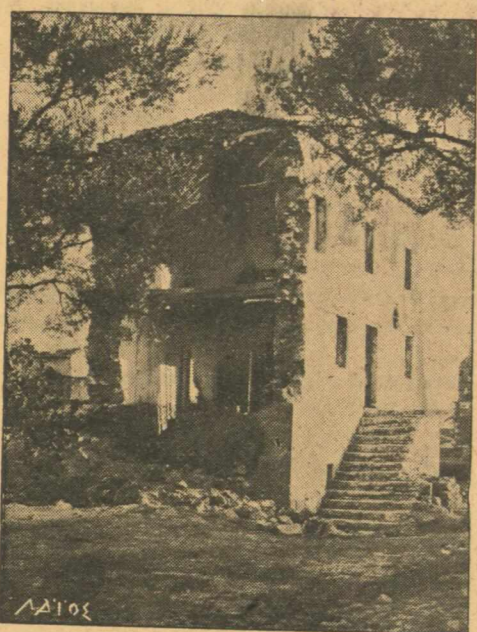
Η ΠΡΩΤΗ ΓΑΛΛΙΚΗ ΠΡΕΣΒΕΙΑ ΕΝ ΕΛΛΑΔΙ ΕΝ ΤΗ ΝΗΣΩ ΑΙΓΙΝΗ ΕΠΙ ΤΗΣ ΕΠΟΧΗΣ ΝΑΠΟΛΙΣΤΡΙΟΥ.

Γάμος γάρ άνθρῶποις εύκταϊον καϊόν. Αρχ. Γνωμικόν.