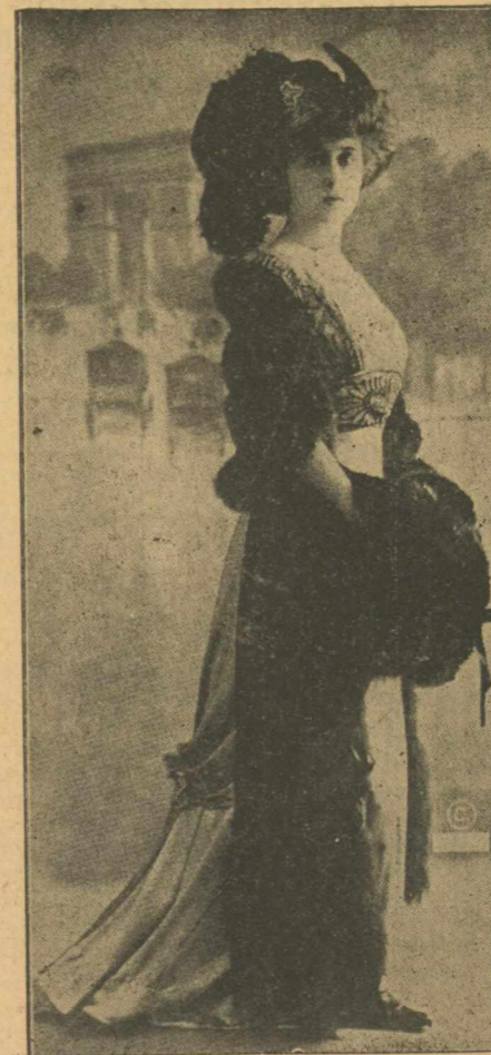
Η Δ ς GABRIELLE ROBINNE

Παρεπιδημοῦσιν κατ' αυτάς εις την πόλιν μας οι διάσημοι Παρισίνο καλλιτέγναι Κοσ Φεραῦδύ έταίρος της Γαλ. Κωμωδίας και ή Δίς Γα Ρομ- πίν της Γαλ. Κωμωδίας.