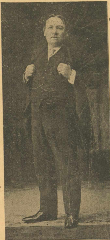
Ο κ. MAURICE DE FÉRAUDY