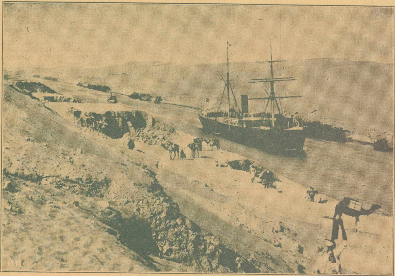
ΣΟΥΕΖ. — ΑΤΜΟΠΛΟΙΟΝ ΔΙΕΡΧΟΜΕΝΟΝ ΤΗΝ ΔΙΩΡΥΓΑ