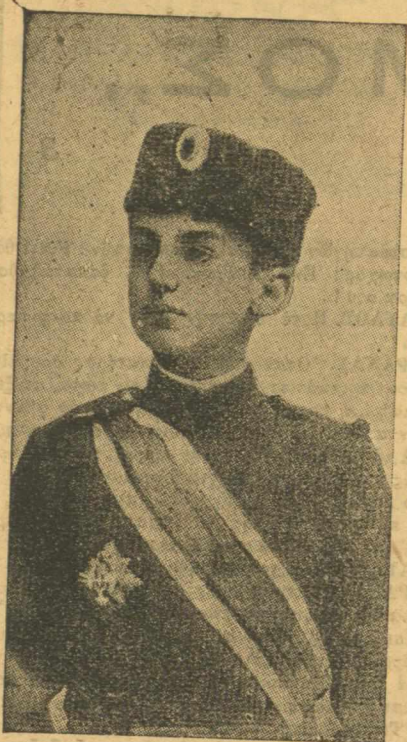
Ο... ταρξίας Διδοχος του Σερβικού Θρόνου