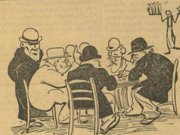
Η... ΕΘΝΟΣΥΝΕΛΕΥΣΙΣ ΣΥΝΕΔΡΙΑΖΟΥΣΑ

να λεχθή και διά την «Αρστωσάν» του κ. Δημητρακοπούλου και «Την μεγάλην ιδέαν» του κ. Βώκου. Τούναντιον, μεγάλην πρόδον έσημείωσεν ο κ. Νικολόπουλος με τό δράμα του ο «Άλλος κόσμος». Κρίμα μόνον ότι έδδθη εις τό τέλος τής παρουσίαν Τήν κωμωδίαν του κ. Μαυρουδή ή «Ήλεκτροθεραπεία» και τό δράμα του κ. Ταγκοπούλου «Εις την εξώπορτα».