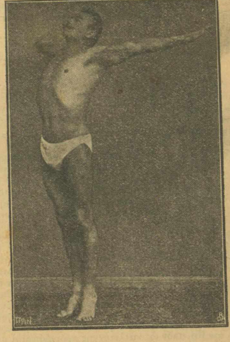
Μερικαί κινήσεις που δίδουν στο σώμα υγιειαν, δύναμιν και ωραιότητα.