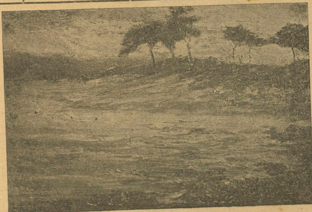
ΠΡΙΝ ΕΝΣΚΗΨΗ. ΘΥΕΛΛΑ