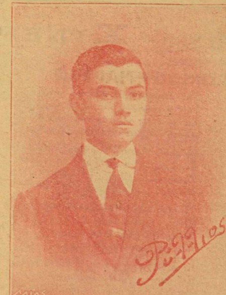
Φύλλοσιν Κλώσιν, ὑποψήφωσιν ἀνταπ. Περνακοῦσιν

Τὸ καίσαριν ἐπέθανε καὶ μαρῶσιν ἔλα Δοὸ ἔλα φθινοπωρῶσιν σὲν κούσιν ἀσθενῶσιν μόνον Σάν δάσιν ποὺ βαρῶσιν ἡ φύσιν ὄμιν χύσει, Γιατὴν παρῶσιν ἔθελα τὸ γέροντα χειμῶσιν. Κι' ἀπὸ τὴν στροφῶσιν χλωροῦσιν: τὴν νεφτικῶσιν καὶ γιὰ σκεπτικῶσιν τὸν ὄμιν γὰρ ἐπέσει, Φύλλα τ' ἀπὸ τῆς κούσιν σὲν κεκοῦσιν γύρωσιν. Κι' ἀπὸ τῆς τῶν ὄμιν μὲ ἀγγεῶσιν τ' ἀπύσει. (Σεπτέμβριος 1908.) Νίκος Τσοῦχλος.