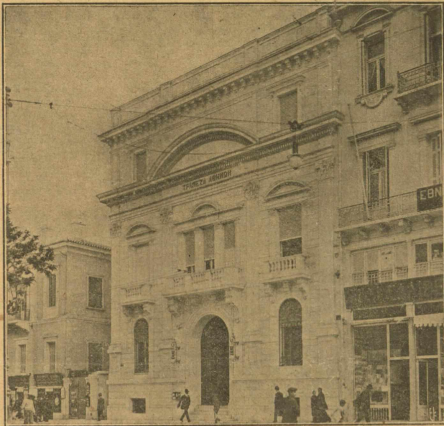
Η ΠΡΟΣΩΠΙΣ ΤΗΣ ΤΡΑΠΕΖΗΣ ΑΘΗΝΩΝ