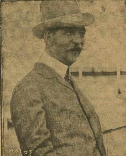
Ο άφιχθείς προχθές βασιλεύς μας, κατά φωτογραφίαν ληφθείς εν Ρώμη.

Οι άνθρωποι οι όποιοι ζώσι δίχως να έχωσιν όρισμένον σκοπόν εν τω βίω των, όμοιάζουσι τούς κοπηλάτας ότινες στρέφουσι τδ νώτα εις τδ σημειον προς τδ όποιον διευθύνονται.