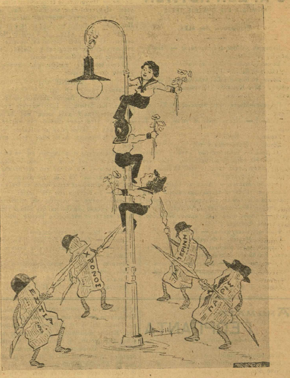
(Φωτογραφία ληφθείσα ύπο έκτάκιον συντάκτου μας έπισκεφθέντος, ιδιαίτέρως ένα έκαστον, τά παιδιά των μαχών.)

Από τόν εκραγέντα... έκφύλιον πόλεμον Ο πολιορκία των Πορτε-άνθου.