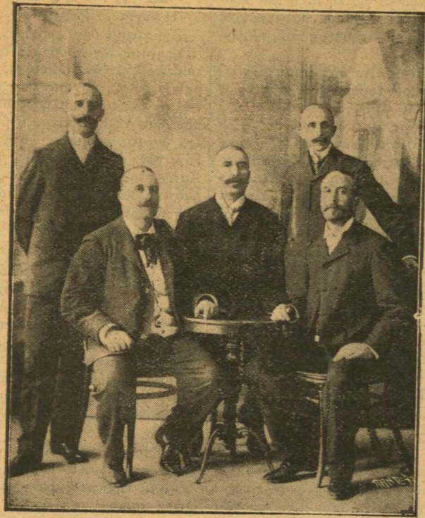
ΟΙ ΠΕΝΤΕ ΑΔΕΛΦΟΙ ΣΤΑΗ