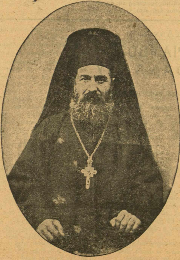
Ο ΑΡΧΙΕΠΙΣΚΟΠΟΣ ΚΥΘΗΡΩΝ