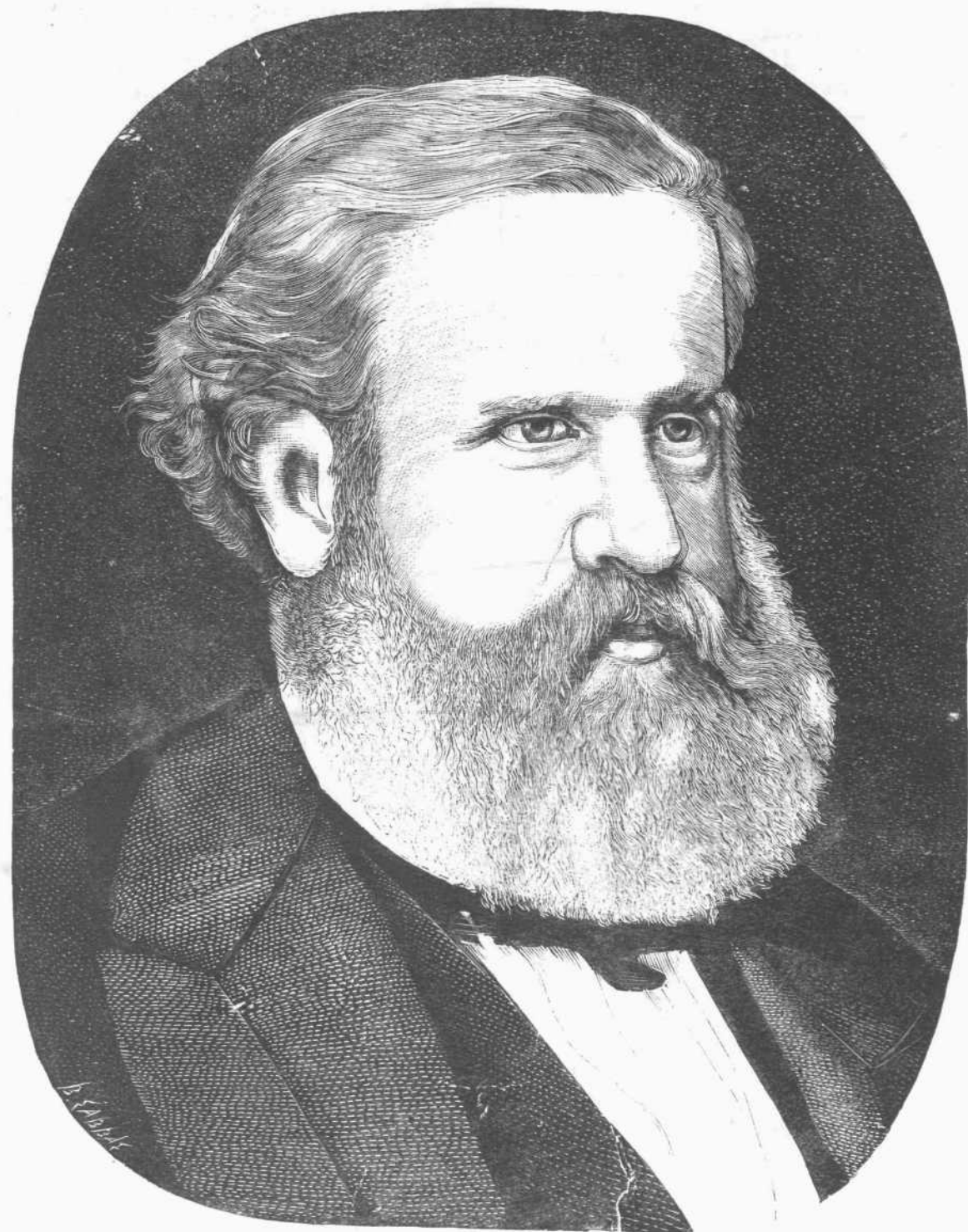
ΔΟΝ ΠΕΤΡΟΣ Β'.