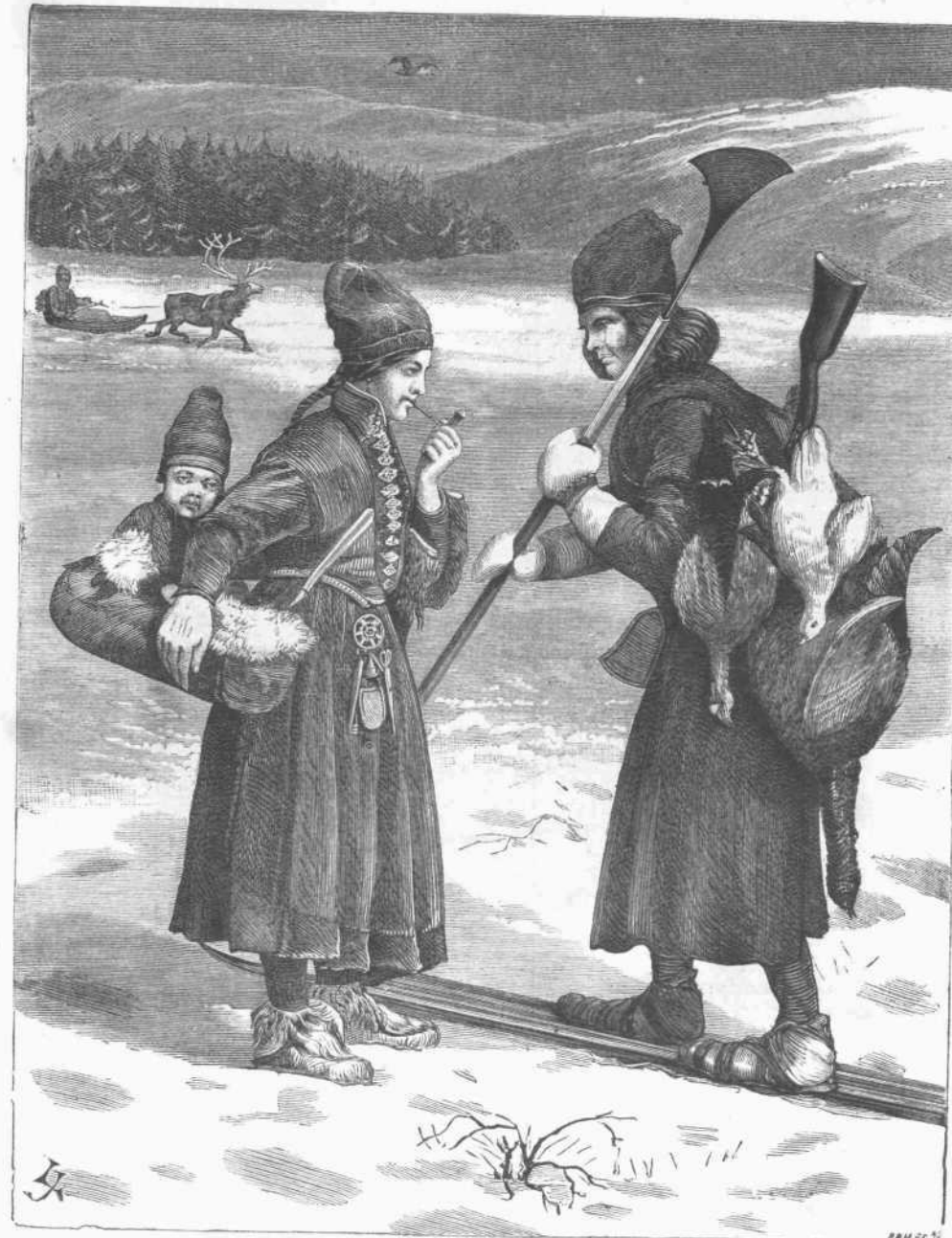
ἨΘΗ ΚΑΙ ΕΘΙΜΑ — ΚΑΤΟΙΚΟΙ ΛΑΘΩΝΙΑΣ (1881 σελ. 150)

(τύπτει τὸ πτώμα) Βλέπεις; ὅταν τὴν ψυχὴν Τὴν μᾶλλον ἠρεμοῦσαν ἢ ἐκδίκησας Ἵθρήση, δὲν κοιμᾶται πλέον τίποτε