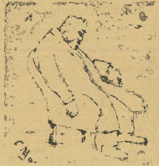
Κατὰ τὴν λογοδοσίαν τοῦ Κιαμὴλ πασᾶ