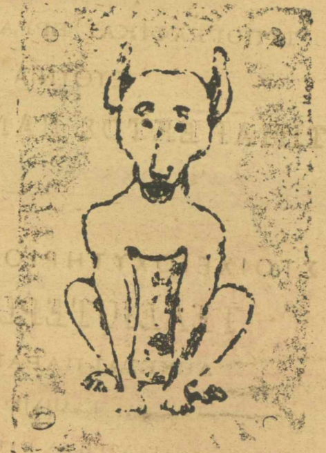
Ο ΠΡΟΕΔΡΟΣ ΤΟΥ ΣΥΛΛΑΛΗΤΗΡΙΟΥ

Εἰς τὸ ἐπόμενον φύλλον θ' ἀρχίσωμεν δημο-σιεύοντες τὸ ΣΥΛΛΑΛΗΤΗΡΙΟΝ ΤΩΝ ΣΚΥΛΩΝ Χρονογράφημα μεθυρογραφικώτατον. Θὰ συναντή-σωμεν εἰς αὐτὸ πρόσωπα γνωστότατα.