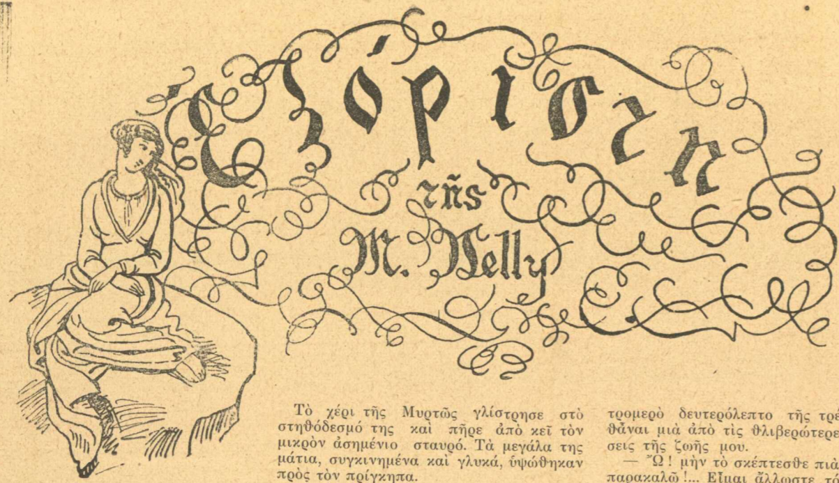
(Συνέχεια ἐκ τοῦ προηγουμένου)