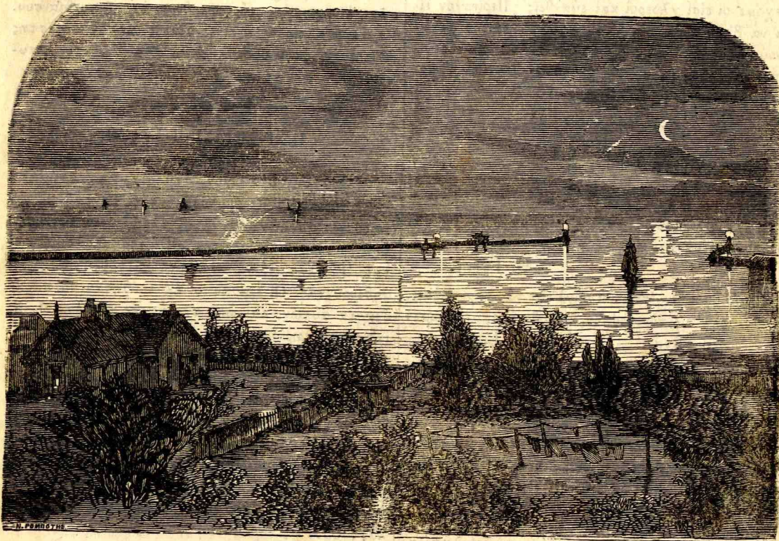
ΣΤΟΜΙΟΝ ΤΟΥ ΣΟΥΛΙΝΑ.

γειτο τόσον διὰ τὸ κρέας του ὅσον καὶ διὰ τὸ πτέρωμά του διὰ τοῦ ὁποίου κατεσκευάζοντο ψιάθοι. Σήμερον ὁμως παρητήθησαν τῆς βιομηχανίας ταύτης, ἥς τὰ κέρδη δὲν ἀνταπεκρίνοντο πρὸς τοὺς κόπους, οὓς αὕτη συνεπήγετο. Ἄλλως τε τὸ πτηνὸν τοῦτο τὴν σήμερον κατέστη σπανιώτατον. Τὸ Ζωολογικὸν Μουσεῖον τοῦ Λονδίνου κέκτηται τρία εἶδη τοιούτων.