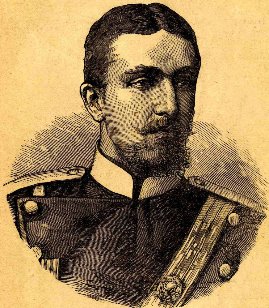
ΑΛΕΞΑΝΔΡΟΣ ΔΕ-BATTEMBERG ΗΓΕΜΩΝ ΤΗΣ ΒΟΥΛΓΑΡΙΑΣ.

πλεῖστον ὑπὸ θαλασσίων πτηνῶν οἷα εἰσὶν αἱ Φρεγάται αἱ Διομήδειαι (Albatros), ὁ Φαέθων και ἄλλα.