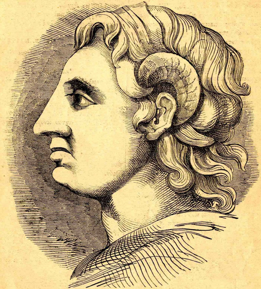
Ο ΜΕΓΑΣ ΑΛΕΞΑΝΔΡΟΣ.

τονταετηρίδος ἐνεκρίθη ἡ ἐπὶ τὸ κρεῖσσον καὶ τελειότερον διασκευὴ τοῦ βουλευτηρίου, ὅπερ καὶ ἐγένετο γενομένης καὶ ἐπεκτάσεως τοῦ κτιρίου διὰ προσθήκης δύο νέων πτερύγων. Ἡ πρόσοψις τοῦ κτιρίου περικοσμεῖται ὑπὸ ὠραίων κιόνων ἐκ μαρμάρου τῆς Μερυλάνδης, τὰ δὲ θυρόφυλλα τῆς εἰσόδου εἰσι κατεσκευασμένα ἐξ ὀρυγάλου μετὰ τοιαύτης τέχνης καὶ τελειότητος ὥστε τὰ ἔξοδα αὐτῶν καὶ μόνων ἀνῆλθον εἰς δύο χιλιάδας λιρῶν.