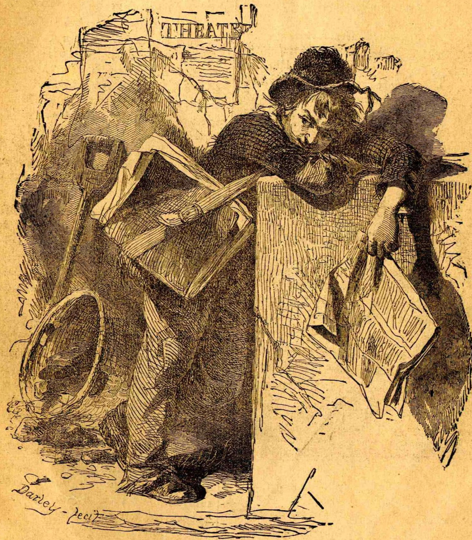
Ο όκνηρός έφημεριδοπώλης.

Ελάχιστος όμως φαίνεται ο αριθμός των συγγραμμάτων άπέναντι της αξίας αυτών, καθότι μέγας αριθμός βιβλίων δεν εύρίσκεται πλέον ήδη ή εν τῇ Έθνικῇ βιβλιοθήκῃ, το δε πολυτιμότερον αυτών μέρος, τά κειμήλια, αποτελείται εκ 54,000 τόμων, ών έκαστος είναι άληθής θησαυρός. Υπάρχουσιν άνεκτίμητα έργα ύπέρ τάς 20,000 άριστουργήματα διασήμων τυπογράφων, άντυπα επί περγαμνηής ή εξαίρετικού είδους χάρτου, ιστορι-