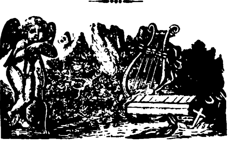
Εἰς λευκῶμα φίλου.