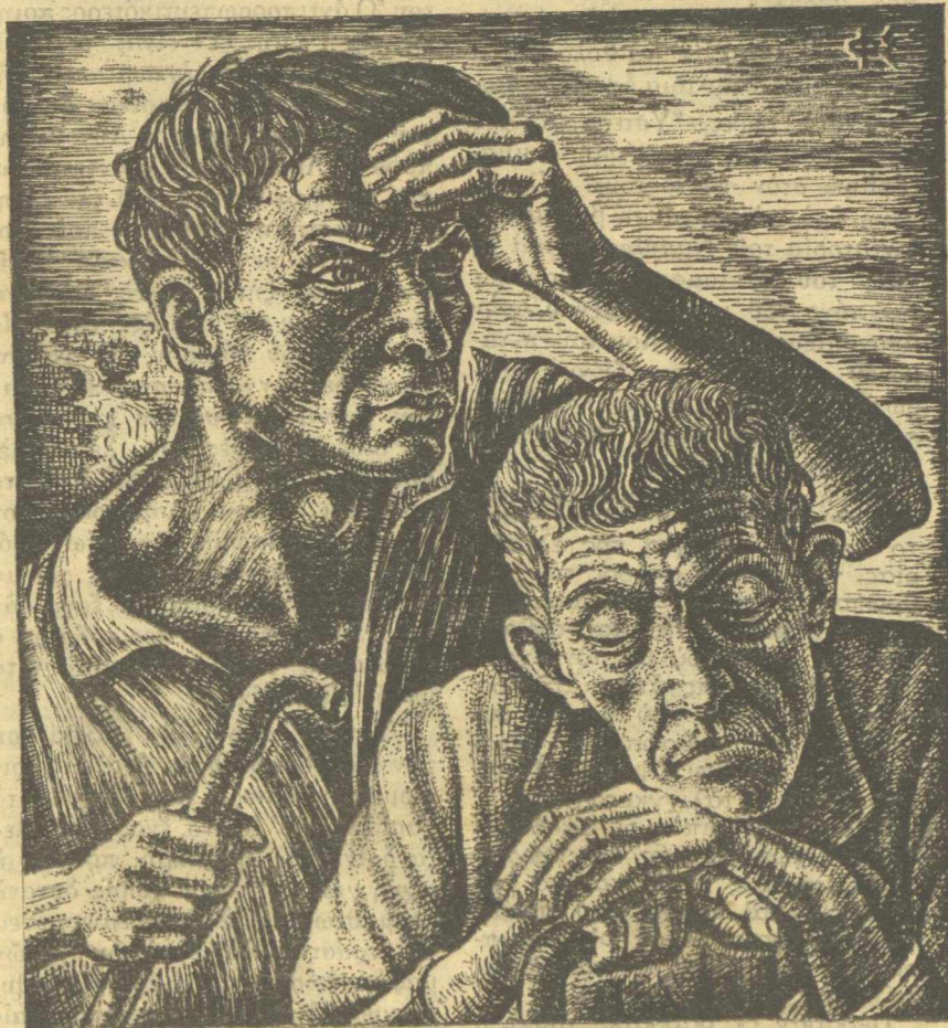
ΦΑΝΗ ΣΑΚΕΛΛΑΡΙΟΥ ΣΧΕΔΙΟ