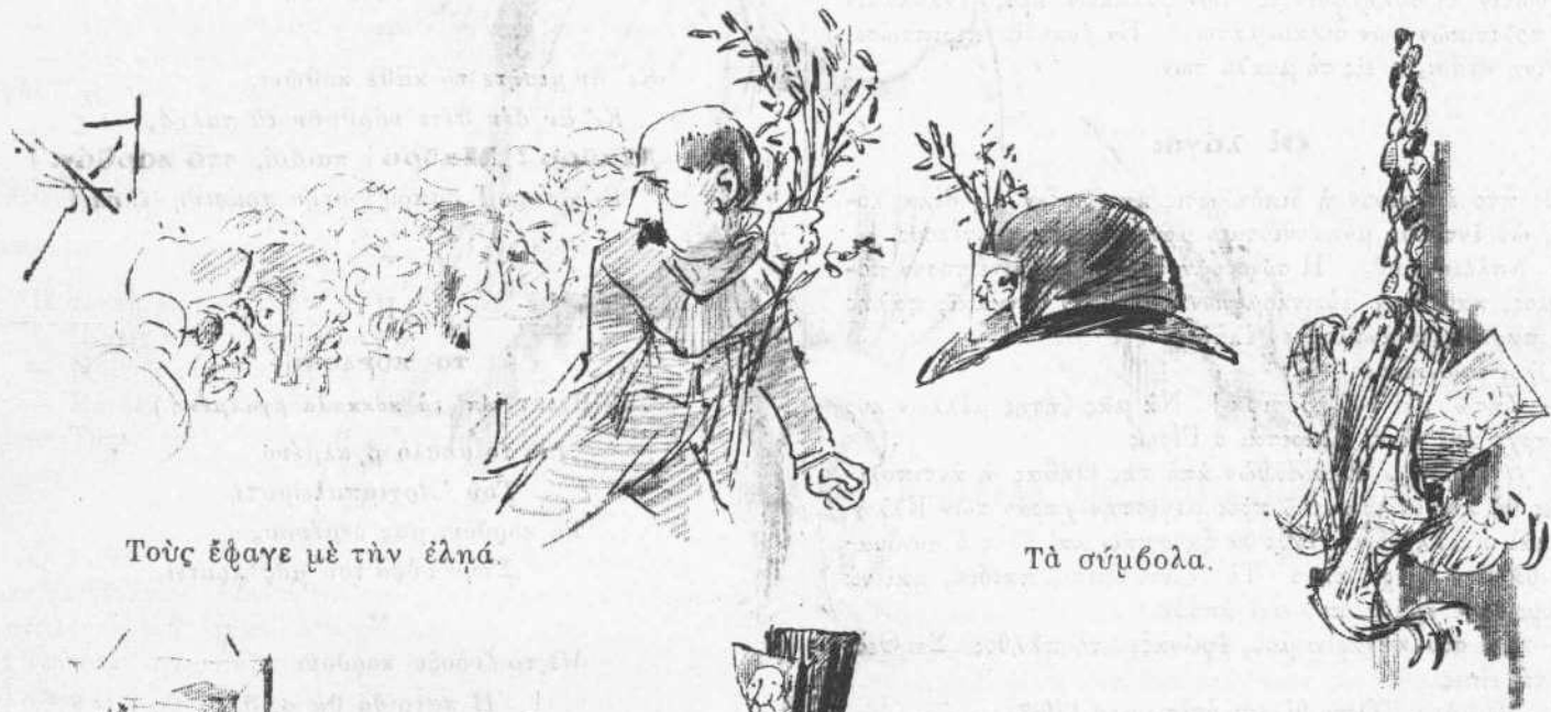
Τοὺς ἔφαγε μὲ τὴν ἑλνά.