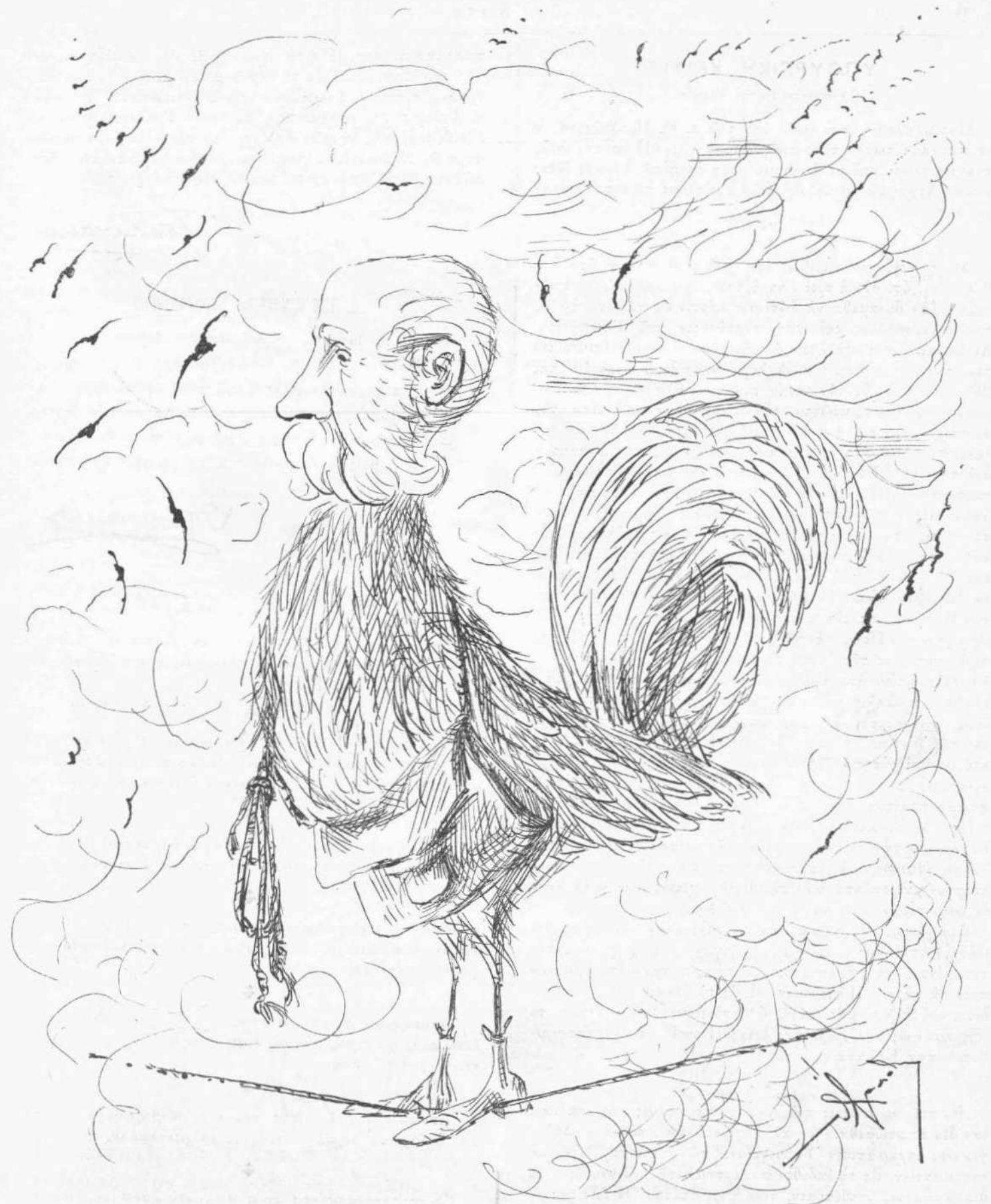
Μετά τήν νίκην