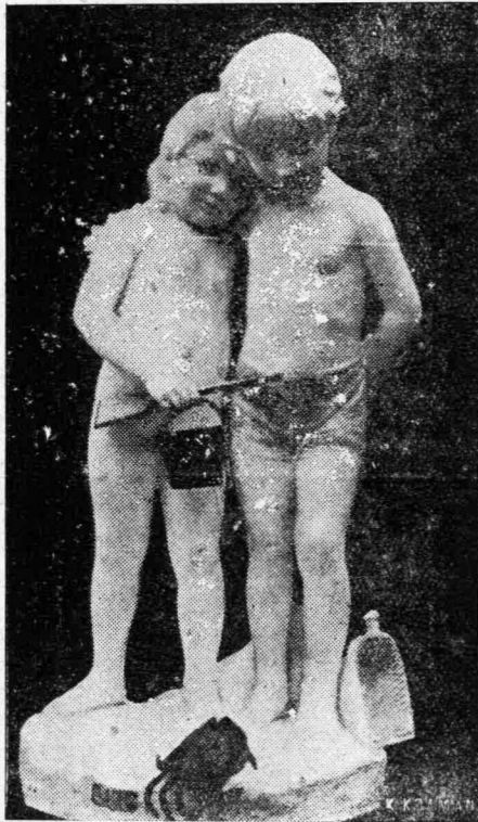
ΤΑ ΠΑΙΔΙΑ ΣΤΗ ΘΑΛΑΣΣΑ