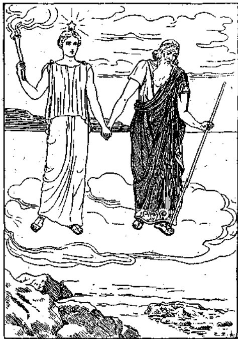
Δὲν εἰμποροῦσε να ἀκούῃ πλέον τίς παραγενέτις του και τὸν ἔβριγε πάλιν εις τὴν γῆν.

Ἐκεῖ τὰ χρόνια ἐκερνοῦσαν χρυσὰ και εὐτυχημένα, ἀλλὰ, ἀλλοίμονον! ή Αύγη, ὅταν ἐξήρχετο ἀπὸ τὸν Δία ὡς μεγάλην χάριν, να κάμῃ τὸν Τίθωνα ἀθάνατον, ἐξέλασε να τὸν παρακάλεσῃ να τὸν κάμῃ και ἀφθαρτον, δηλ. να μὴ