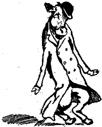
Ἐν τούτοις ὁ Γερωτράγος ψιδυ- ρίζει μέσα του.... (Σελ. 54).

Γνωρίζετε τί εἶναι ἡ «Βιβλιοθήκη τῆς Τόπειας»;