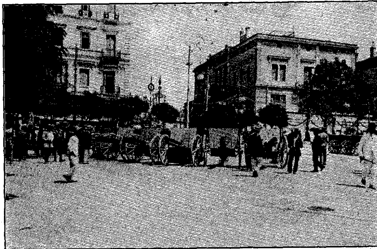
Άπό την ύποδοχην της Α.Μ. του Βασιλέως Κωνσταντίνου του ΙΒ'.

Οι πέντε άνδρες έτέθησαν εις έργον' μαζί δε με αυτούς και εγώ και ο δεύτερός μου. Άλλ' ένψ, ήσυχολούμεθα εις αυτήν την εργασία, ένας από τους ναύτας, ο έκτος ήτο άνεβασμένος εις το κατάρτι διά να λύση τα πανιά, κατέβηκε εις τα σχοινιά έως το μέσον της σκαλωσιάς, άφηκε μίαν κραυγήν, έκρημάσθη ως πιγμένος και έμεινεν άκίνητος. Βλέπων ότι δεν έκινείτο πλέον, έφώναξα τον δεύτερον, όστις ήτο όλίγον ύψηλότερα να έδω τί συμβαίνει.