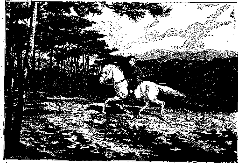
Σε λιγάκι εφθασε στο βουνό που ήτο γεμάτο από ελατα.

Είπε και εγεινε άφαντη, αυτή και τo μνημα με τους