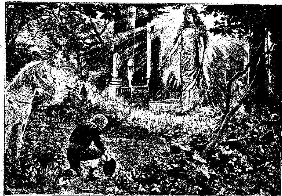
Όςλω ώραία Κυρία να έλθης να κατοικήσης μαζί μας.