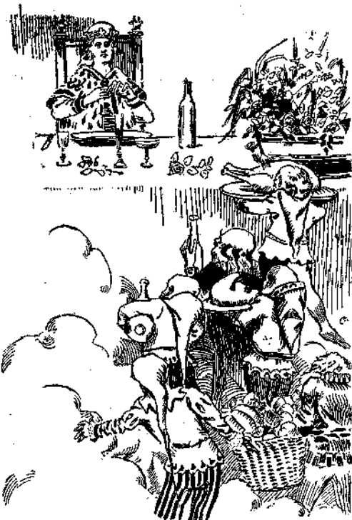
Καὶ ἀμέσως ἓνα σύννεφο ἀπὸ καλικαντζάρους φορτωμένους μὲ διάφορα φαγητὰ καὶ ὅλα τὰ εἶδη τῶν φρούτων καὶ τῶν γλυκισμάτων καρουσιάζθη.

— Αὐτὸ εἶναι τὸ βασιλεῖόν σου, πρίγκιψ! πῶς σοῦ φαίνεται;