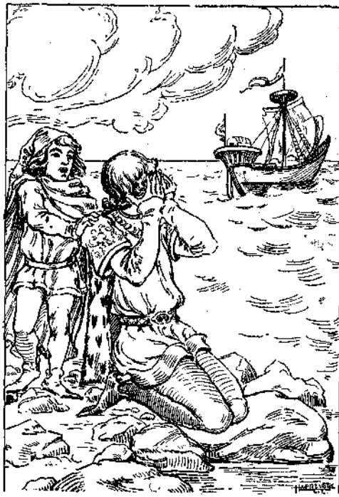
Ὁ νάνος τὸν ἐπλησίασε καὶ τοῦ εἶπε: «Μικρὸ παιδί μου, τώρα κατόρθωσες νὰ σπάσῃς τὴν ἀλυσίδα ποὺ σὲ κρατοῦσε αἰγμάτων.

«Ἀχ! πόσον βιάζομαι ν' ἀγκαλιάσω τὴν μητέρα μου! τὴν καλὴ μου μητέρα ποὺ τὴν τυράννισα τόσο πολύ! Πόσον ἤθελα νὰ ξαναἰδῶ τὴν χαριτωμένην ἐκείνην πριγκηπίσσαν, τὴν ὁποίαν ἐδιώξην ἡ σκληρότης μου!