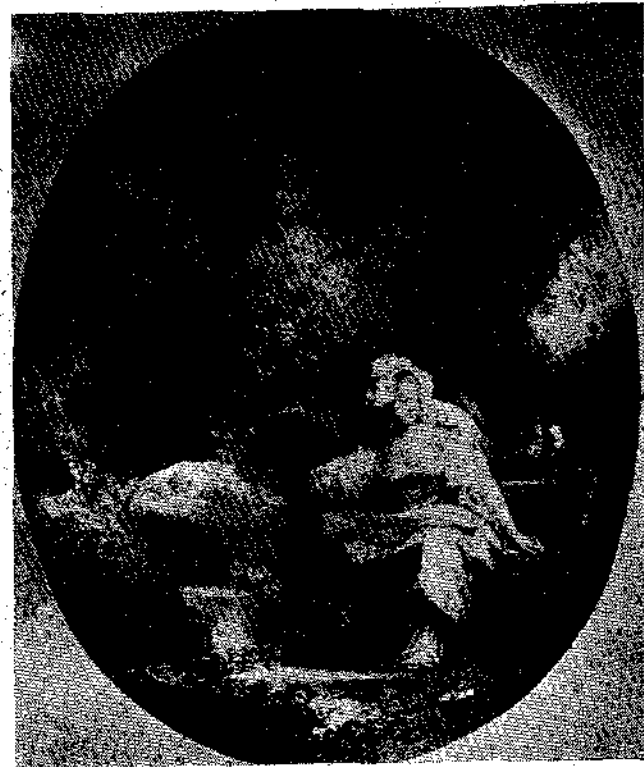
Ὁ ἠραιότερος αὐτὸς πίναξ, τὸν ὁποῖον βλέπετε, ὑφίσταται εἰς τὸ πινέλον τοῦ περιφήμου ζωγράφου Φραγκουάρι καὶ παριστάνει γυναῖκα τῆς ἀριστοκρατίας τοῦ μεσαίωνα νὰ βυζαίνῃ ἡ ἴδια τὸ παιδί της κάτω ἀπὸ πλατύφυλλον δένδρον.

Εἰς τὴν ἀρχαιότητα ἡ μητέρα ὑπερρεῖς διὰ νόμου νὰ βυζαίνῃ τὸ παιδί της. Κατὰ τὸν Μεσαίωνα αἱ ἀριστοκράτιδες μετ' ὑπερηφανείας ἔτρεφον τὰ τέκνα των. Ἀναφέρεται μάλιστα καὶ τὸ ἔξης: Ἡ σύζυγος τοῦ Λουδοβίκου ΙΧ, ὅταν ἔμαθε ὅτι κατὰ τὴν ἐπιγοήμερον ἀδιαθεσίαν της, μία τῶν κυριῶν τῆς τιμῆς ἐδύλαξε τὸ παιδί της, ἔβαλε τὸ δάχτυλον στὸ στόμα τοῦ παιδιοῦ της καὶ τὸ ἔκανε νὰ ξερᾷ τὸ ξένον γάλα λέγουσα: Ποτὲ δὲν θὰ ἐπιτρέψω εἰς ἄλλην γυναῖκα νὰ μοῦ βεαρπάσῃ τὸ πρῶτον μητρικὸν καθήκον.