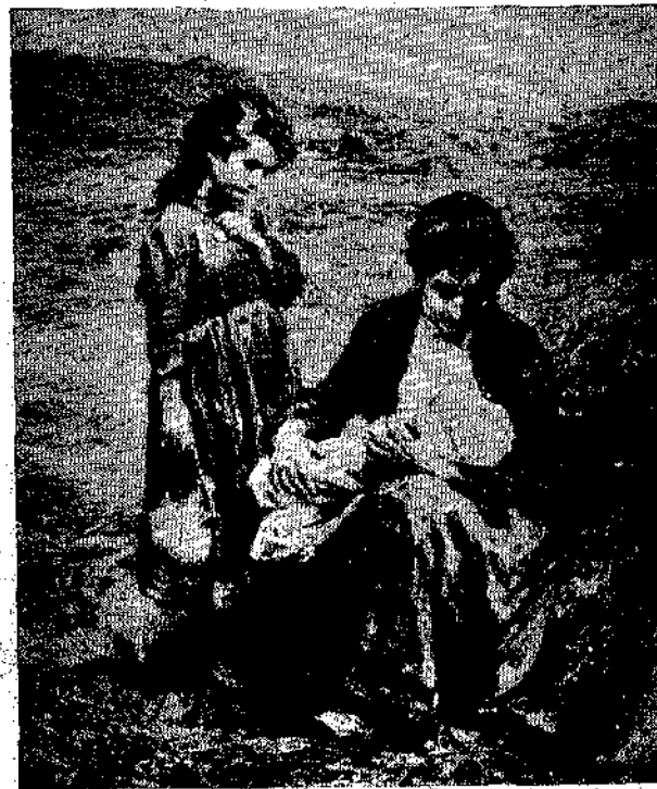
Τὸ κυριώτερον καθήκον μιᾶς μητρός εἶναι νὰ δηλήσῃ τὴν μόνην της, μετὰ τὸ καθαρόν μητρικὸν γάλα, τὸ παιδί της. Ὡς κοινὰ γὰρ ἀισθάνεται ἡ μητέρα ὅταν βλέπῃ τὸ παιδί της νὰ γέρνῃ τὸ κεφάλαιον του πάνω εἰς τὰ φουσκωμένα ἀπὸ τὴν μητρικὴν ἀγάπην, στήθη της. Τὸ αἶσθημα τοῦτο τῆς μητρός, τὸ ἀπέδωκεν μετὰ τελειότητα μόνον ὁ διάσημος ζωγράφος Λεομὲν εἰς τὸν ἀνωτέρω πίνακα του.

Κατὰ τοὺς τελευταίους αἰῶνας παραδόξως αἱ μητέρες παρημέλησαν τὸ πρῶτον τους τοῦτο καθήκον καὶ ἀνέθηκεν τὴν διατροφήν των παιδιῶν των εἰς διαφόρους τροφῆς (παραμάνας). Καὶ ἔξῃ ἐξηκολούθει νὰ ἐπικρατῇ αὐτὴ καὶ σήμερον αὐτὴ ἡ καταστρεπτικὴ διὰ τὴν ἀνθ.ωπότητα συνήθεια, ἂν δὲν ἐνεφανίζετο ἕνας Ρουσῶ, ὁ μέγας αὐτῆς φιλόσοφος, ὁ ὁποῖος διὰ τῶν συγγραμμάτων του ἐστιγμάτισε τὴν συνήθειαν ταύτην.