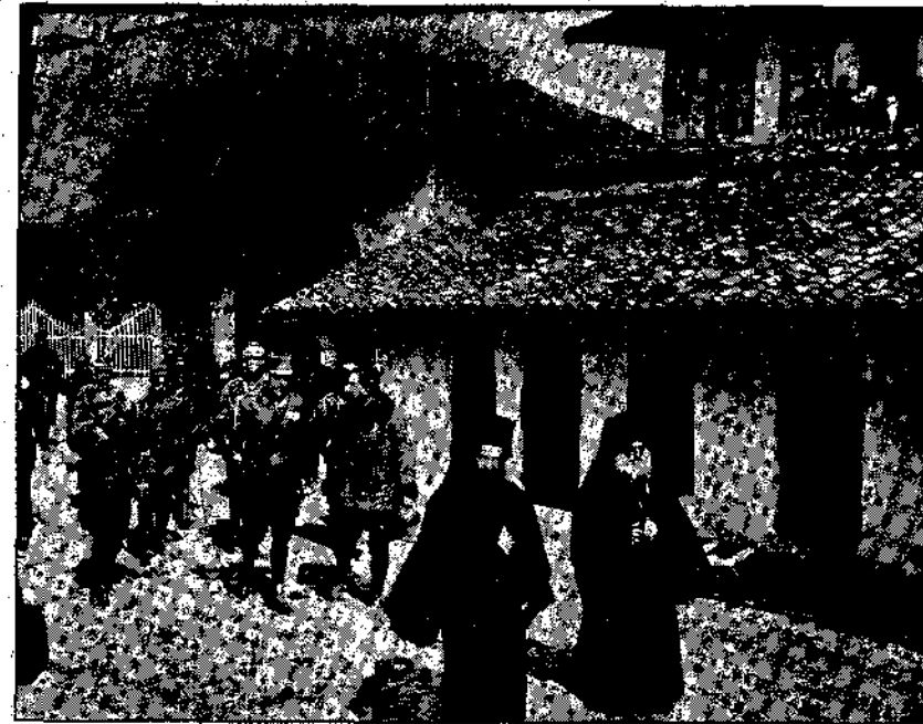
Ὁ διάδοχος, Κωνσταντῖνος ἄμα τῆ ἐξόδῳ του εἰς τὰ Ἰωάννινα, μεταβαίνει εἰς τὴν μητρόπολιν πρὸς δασολογίαν.

Φέρνεις τροπικὰ θριάμβους!... μὰ καὶ τί χροσὲς ἐλπίδες Εἰς τὸν κόσμον δὲ χαρίζεις, μετὰ τὰ τροπικὰ αὐτά. Σὲ ψυχὰς σκοτεινωσάμενες πόδες δὲν σκορπῆς ἀχιῦδες, Πόσα μάτια δὲ στεγνάνεις ἀπὸ δάκρυα φοιητὰ!