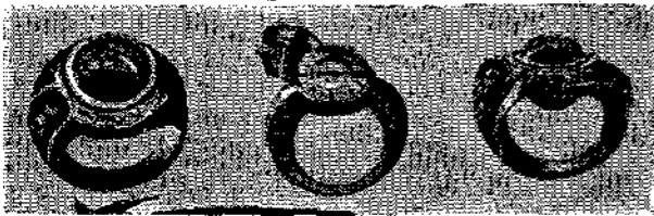
Δακτυλίδια αρχαιότατα τά όποια έφορον οι Ρωμαίοι και οι Έλληνες ως φυλακτά. Το μεσαίον φέρει έκείνου του και ήλιων όφολόγιον.

Το δακτυλίδι έπαιζεν εις την ζωήν τόνον τών ανθρώπων όσον και τών έθνών ρόλον σπουδαίωτατον. Εις κάθε με-