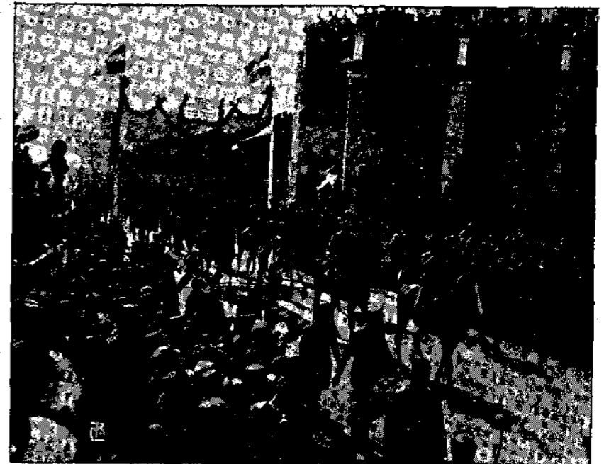
Η θριαμβευτική είσοδος του διαδόχου Κωνσταντίνου εις τά Ίωάννινα.

Και αν τολώση ή ψυχή σου Τή μεγάλη έντευχία, Όπου τολώθει καθ' ανθρωπόπου Η τρισεύγενη ψυχή, Εύτυχής κι' άπότ' να γίνη Κι' ή Πατρίς να έννιχί.