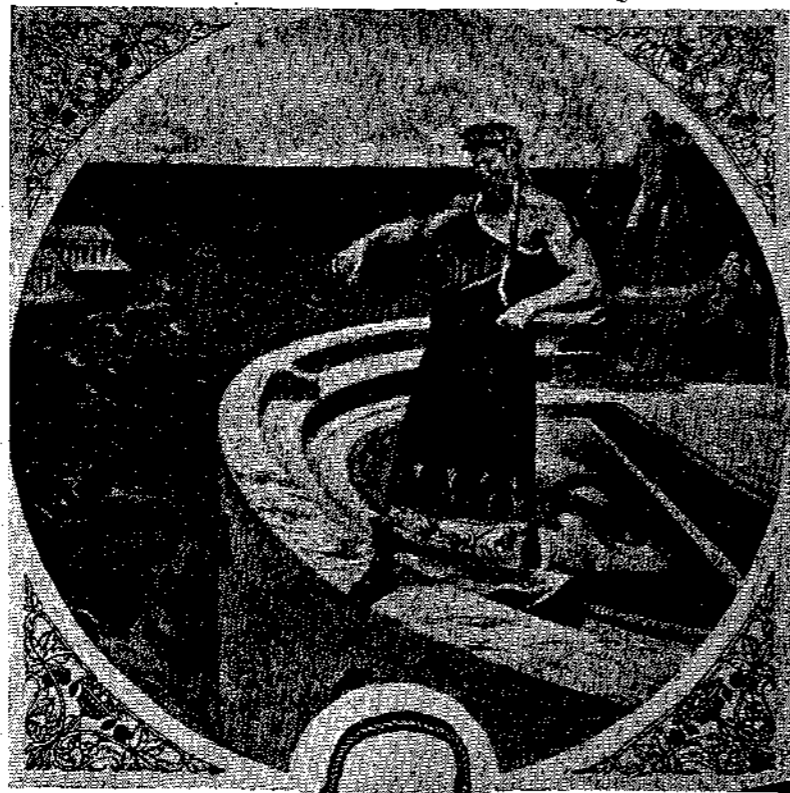
Το δακτυλίδι εις την αρχαιότητα ήτο ιερών συμβόλων τής δυνάμεως. Η ειών αυτή παριστά τον Πολυκράτην, τον περιφημον τυράννον τής νήσου Σάμου να

Όταν ο Φαραώ έπροβίβασε τον Ίωσήφ εις τό πρωθυπουργικόν αξίωμα, του έπέρασε εις τό δακτυλό του και ένα