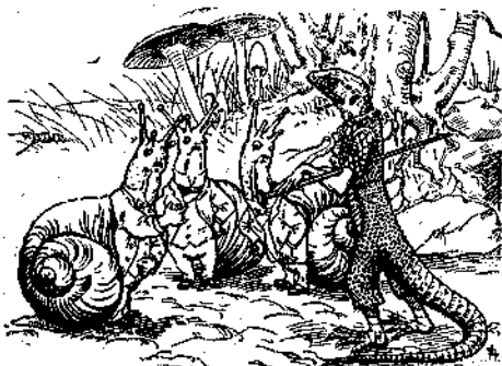
Ε! τα μάθατε λοιπόν υπαίμακες; η Κυβέρνησις απέφασε να βάλη φόρο εις τα κινητά σπίνια και άλλομονό σας! ειπεν η σαύρα εις τα τρία σαλιγκάρια, ένα από τα όποια άγορεύερα της έδωσεν ένα πολύ καλό μάθημα, με το όποιον της έδωσε να καταλάβη ότι δεν πρέπει να φηροδερρηφανεύεται.