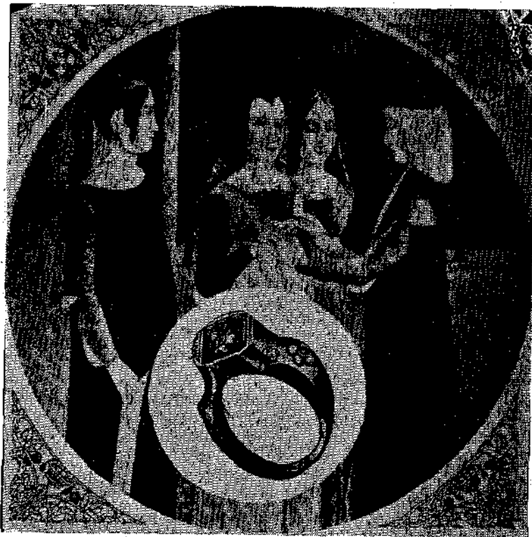
Σηνή αρραβώνος κατά τον μεσαίωνα. Ο μνηστής παρουσιάζει στενατότου κόκλου συγγενών περνα το δακτυλίδι εις το δακτύλο της μνηστής του

Αργότερα, κατώρθωσαν οι διάφοροι έραστοι κατοπιν επιπόνου μικροσκοπικής εργασίας, να χαραξουν επί του άνω μέρους της αρραβώνος το όνομα της μνηστής των ή και αυτήν ταύτην την προσωπογραφίαν των.