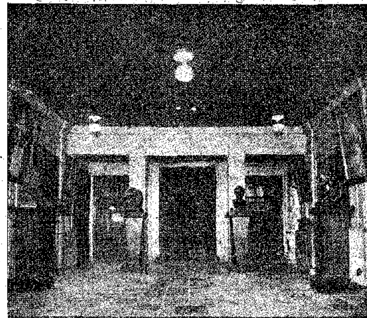
ΕΘΝΙΚΟΝ ΘΕΑΤΡΟΝ ΒΟΥΚΟΥΡΕΣΤΙΟΥ

Την πρώτη θέση στα έδω θέατρα, όπως είναι και φυσικό, την κατέχει το Έθνικό. Τα θέατρα που διοργανώνει το θέατρο αυτό είναι από πάσης απόψεως πρώτης τάξεως. Τα υλικά