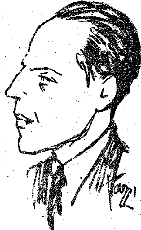
ΠΑΝΟΣ Δ. ΤΑΓΚΟΠΟΥΛΟΣ (Σκίτσο Άντ. Πρωτοπάτη)

συντομία τής τρία τέταρτα τής ώρας, στράφηκε γύρω στην κοινή αντίληψη ότι ο Ποιητής τού «Δωδεκάλογου» και τών «Βωμών» είναι