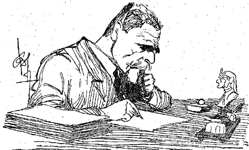
Ο ΠΑΛΑΜΑΣ ΣΤΟ ΓΡΑΦΕΙΟ ΤΟΥ

Πενήντα χρόνια επίμονης και συστηματικής εργασίας από την εποχή του Ειρηναίου του Ασωπίου (1876) γιορτασθήκανε στο Μαρούσι την Κυριακή το δειλινό, 11 Σεπτεμβρίου 1927. Τρεις τέσσαρις θανμαστές του Παλαμά (και συγκεκριμένα, οι ποιητάι Πάνος Ταγκόπουλος και Θανάσης Κυριαζής, ο μεταφραστής του Πα-