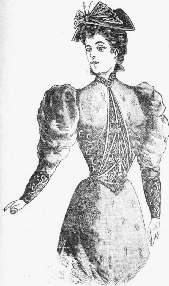
Τὸ φόρεμα τῆς ἐποχῆς.

Ὁ Διοικητὴς, ὡς Ἐπιτηρητὴς τῆς Ἀποικίας εἶναι ἀνότατος ἐν ταῖς γαμη- λιαῖς ὑποθέσεσιν. Οὗτος ἐκδίδει ἀδείας, κρατεῖ ληξιαρχικὰ βιβλία, ἐκφέρει τὴν . . . εὐλογίαν, καὶ εἶναι μάρτυς τοῦ μυστηρίου συνάμματος. Τὸ μεγαλύτερον μέρος τῶν ἰσοβίων καταδίκων, ἐξ ἐκείνων οἵτινες εἶναι καλοῦ χαρακτῆρος, εἶναι «αὐτοσυντήρητοι» — τοῦ- τέστι διημερεύουσι μεθ' ἐπὶ «ἀπουσίας ἀδείας» ἐπὶ τῆς νήσου. Εἰς τοὺς ἀνθρώπους τούτους ἐπιτρέπεται νὰ νυμφεῖωνται. Ἀπ' ἐτέρου αἱ κατὰδικοὶ γυναῖκες κρατοῦνται πάντοτε ὑπὸ ἄμεσον ἐπίβλεψιν ἐν ταῖς εἰρημαῖς τῶν θηλέων. Ὅταν, ὁ «αὐτοσυντήρητος» ἐνοχλεῖται ἀπὸ ὑμεναιακῆς ἐπιθυμίας, ἐπι- σκέπτεται τὰς εἰρημαῖς τῶν θηλέων καὶ εἰ- δοποιεῖ τὸν ἐπιστάτην. Τὸ ἄτομον τοῦτο