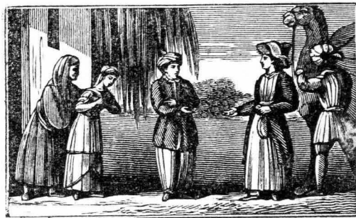
ΑΙ ΩΡΑΙΑΙ ΤΗΣ ΚΙΡΚΑΣΣΙΑΣ.

χρονικὰ τοῦ κόσμου εὐγενῆς καὶ ἀξιοθαύμαστον παράδειγμα νίκης ἀγάπης καὶ ἀτρόμητου ἡρω- ῖσμου.