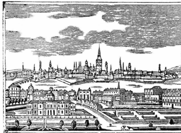
Η ΠΟΛΙΣ BIENNA.

Τὸ 1836 κατεδικάσθησαν εἰς τὰς φυλακὰς τοῦ Λονδίνου 25,000 διάφοροι πταισται, τῶν χρεωφειλετῶν ἐξαίφουμένων. Τοῦ πληθυσμοῦ λογαριαζομένου εἰς 1,600 χιλιάδας, ἐπεταὶ ὅτι 1 εἰς 64 εἶναι κακοῦργος.