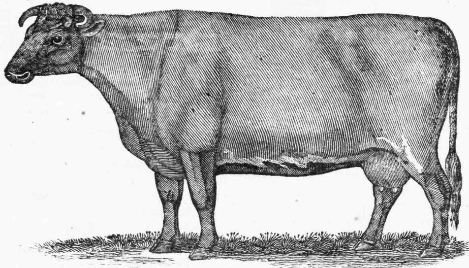
ΔΑΜΑΛΙΣ, ἢ ΒΟΥΣ.

Ἐκ τῶν πολυαριθμῶν ζώων, ἅτινα πληροῦσι τὴν γῆν, δὲν ὑπάρχει κἀνὲν ἀξιολογώτερον τῆς Δαμάλεως· ὁ ἵππος εἶναι ὡς ἐπιτοπλεῖστον ἰδιοκτησία τῶν πλουσίων· τὸ πρόβατον ἀκμάζει μόνον ἀγελῆδον, καὶ ἀπαιτεῖ ἀδιακόπως τὴν μεγίστην ἐπιμέλειαν· ἀλλ' ἡ Δάμαλις εἶναι εἰς τὰς κτηνοτρόφους χώρας τὸ καύχημα τοῦ πτωχοῦ, ὁ πλοῦτος καὶ τὸ ὑποστήριγμά του. Τὸ κλίμα καὶ αἱ παχεῖαι νομαὶ τῆς Μεγάλης Βρετανίας φαίνονται ἰδιαιτέρως κατάλληλα εἰς τὴν φύσιν καὶ τὸ σωματικὸν σύστημα τῆς Δαμάλεως· διότι, παρατηροῦσα τὴν ποσότητα μᾶλλον ἢ τὴν ποιότητα τῆς τροφῆς της, δυσκολεύεται πολλαχῶς νὰ εὕρῃ τὴν ἀπαιτούμενην. Αἱ παρ' ἡμῶν βόες εἶναι ὡς ἐκ τούτου πολὺ κατώτεραι τῶν ἐν Ἀγγλίᾳ καὶ ἄλλαις βορειναῖς χώραις.