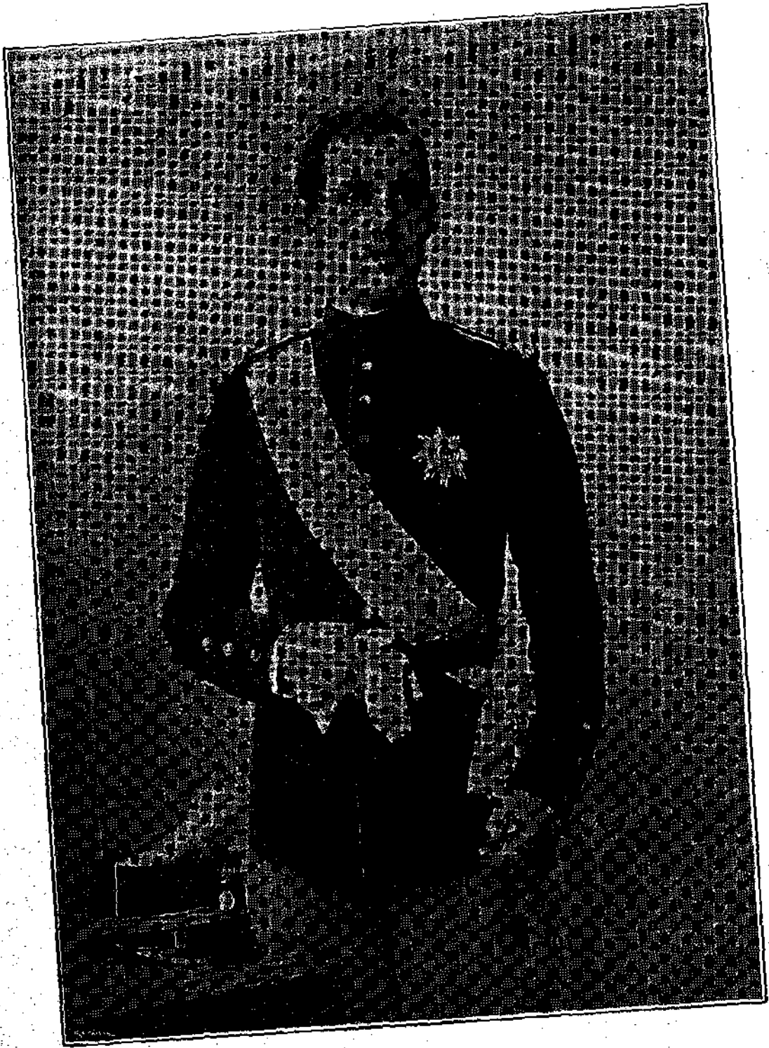
Η Α. Μ. Ο ΒΑΣΙΛΕΥΣ ΚΩΝΣΤΑΝΤΙΝΟΣ ΙΒ'. ΚΑΤΑ ΤΗΝ ΕΠΟΧΗΝ ΤΗΣ ΜΗΧΕΤΕΙΑΣ ΤΟΥ