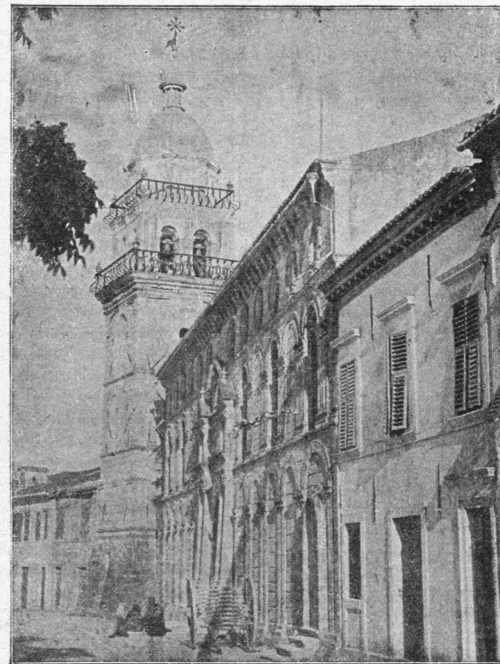
ΟΙ ΩΡΑΙΟΤΕΡΟΙ ΝΑΟΙ ΤΗΣ ΖΑΚΥΝΘΟΥ

Τὸ γραφεῖο τοῦ ποιητοῦ που σήμερα ἀνθοστόλισεν ή ἀγάπη αὐτὴ εἶναι ναὸς μικρὸς, εις τὸν