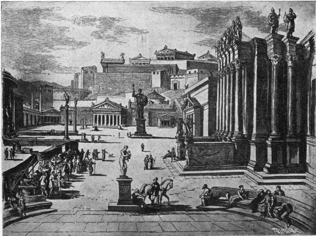
Η ΑΓΟΡΑ ΤΗΣ ΑΡΧΑΙΑΣ ΣΠΑΡΤΗΣ