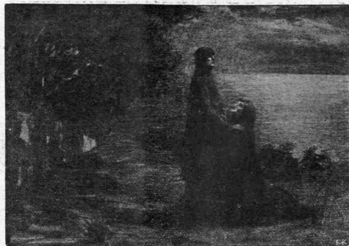
Ἡ Θεοδώρα καὶ ἡ Κασσιανή

— Βασιλείε, εἶσαι τρελλός ... ἐφώνησεν ὁ Κωνσταντῖνος Ἰμβριος.