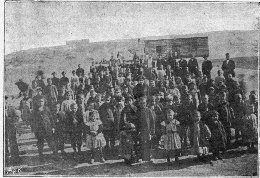
Τὰ ὀρφανὰ προσφυγόπαιδα.