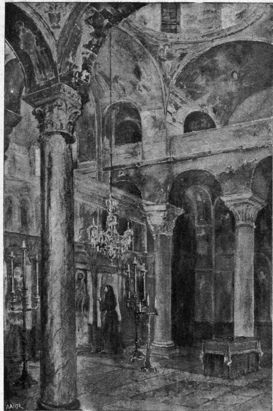
ΜΥΣΤΡΑΣ.—Α ΖΑΧΟΥ.—ΕΣΩΤΕΡΙΚΟΝ ΠΑΝΤΑΝΑΣΣΗΣ

— Σοῦ ἔφερα, Δέσποινα τῶρα μὲ τ' ὀλόγιμο φεγγάρι, ἕνα καινούργιο φυλακτὸ διὰ τὴ