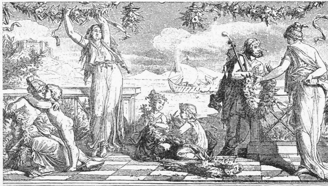
ΑΓΟΡΑ ΑΝΘΕΩΝ ΕΙΣ ΤΑΣ ΠΑΛΛΙΑΣ ΑΘΗΝΑΣ