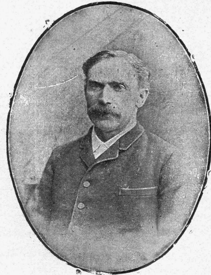
ΔΗΜΗΤΡΙΟΣ ΠΑΛΛΗΣ Πρωθυπουργὸς καὶ ὑπουργὸς ἐπὶ τῶν Οἰκονομικῶν.

Τοῦτο δὲν τὴν ἠμπόδισε μετ' ὀλίγον νὰ σκεφθῇ ὅτι ἦτον ἡ ὥρα τοῦ φαγητοῦ καὶ νὰ καλωπισθῇ διὰ νὰ καταβῇ εἰς τὸ τραπέζι.