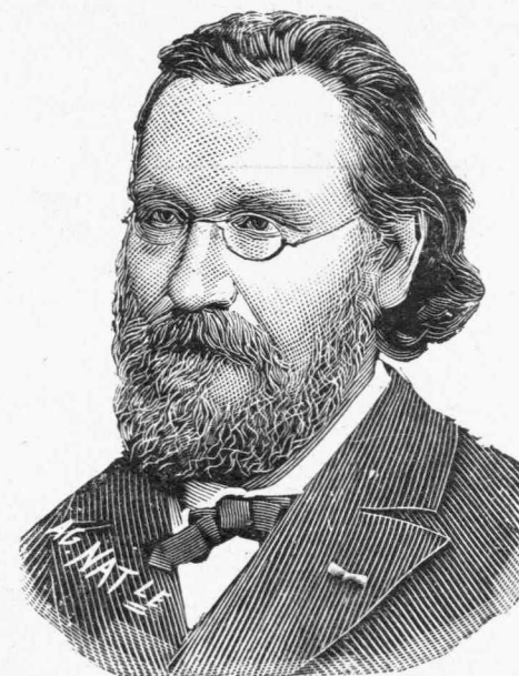
Ὁ ΜΕΤΖΝΙΚΩΦ, ὁ ἐπισκεφθεὶς τελευταίως τὸν Τολστόη εἰς τὴν Γικσνάια-Πολιάνα.

Ἐν τῷ ἀπέραντον, μεγαλοπρεπές, ἀτελείωτον κλείει ἀπὸ τὰς τρεῖς πλευρὰς τὴν αὐλὴν αὐτὴν μὲ τὸ κυρίως κτίριον τῆς σχολῆς, μὲ παράρτημα τάξεων διὰ τὸ προστεθεὶν ἐμπορικὸν τμήμα καὶ