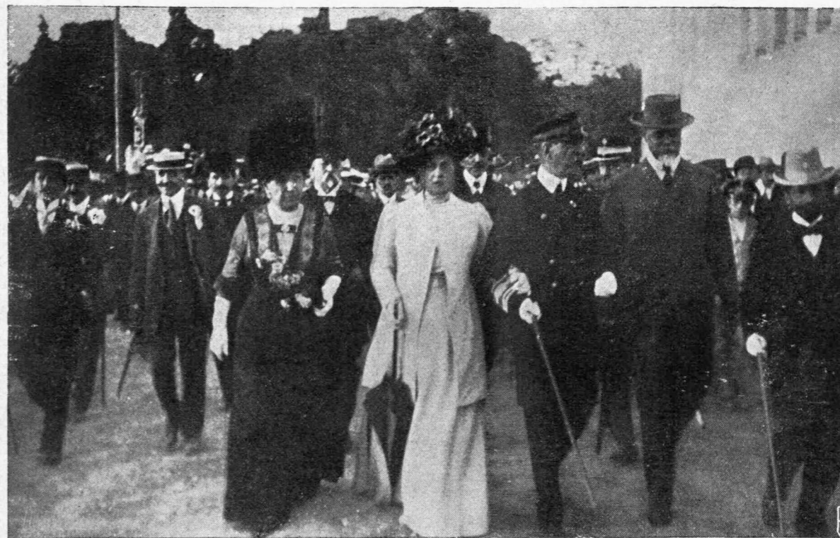
Ἡ ἐορτὴ τῶν Ἀνθῶν εἰς τὸ Ζάππειον

τῆς 8ης Μαΐου, ἡ διοργανωθεῖσα παρὰ τῆς κ. Σοφίας Σηλήμαν καὶ τοῦ δημάρχου κ. Μεροκούρη