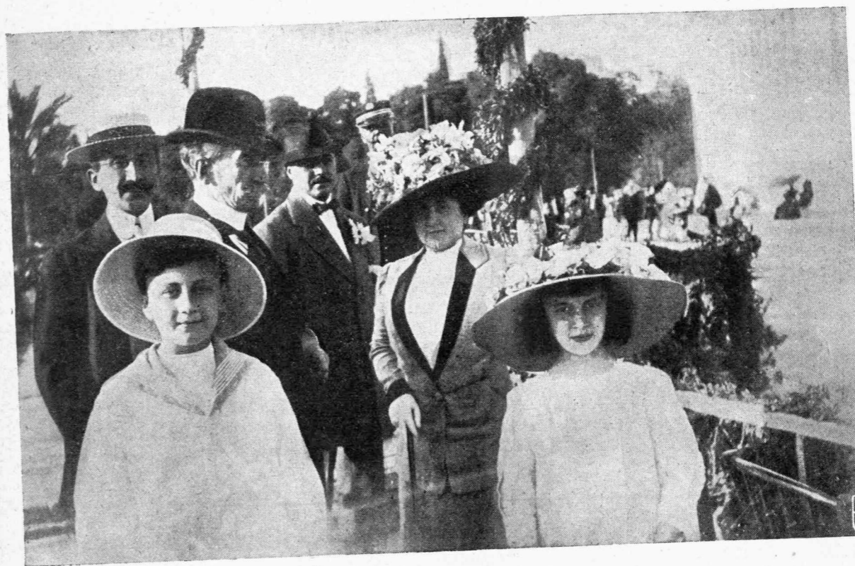
Ἡ ἐορτὴ τῶν Ἀνθῶν εἰς τὸ Ζάππειον

Μετὰ τοὺς ἀνωτέρω χορούς τμημα ἐρασιτεχνῶν ἐκ τῆς ὀρχήστρας τῆς Ἀθηναϊκῆς Μινδολινάτας ἐκτελεῖ τὸν Ἑλληνικὸν χορὸν τοῦ κ.