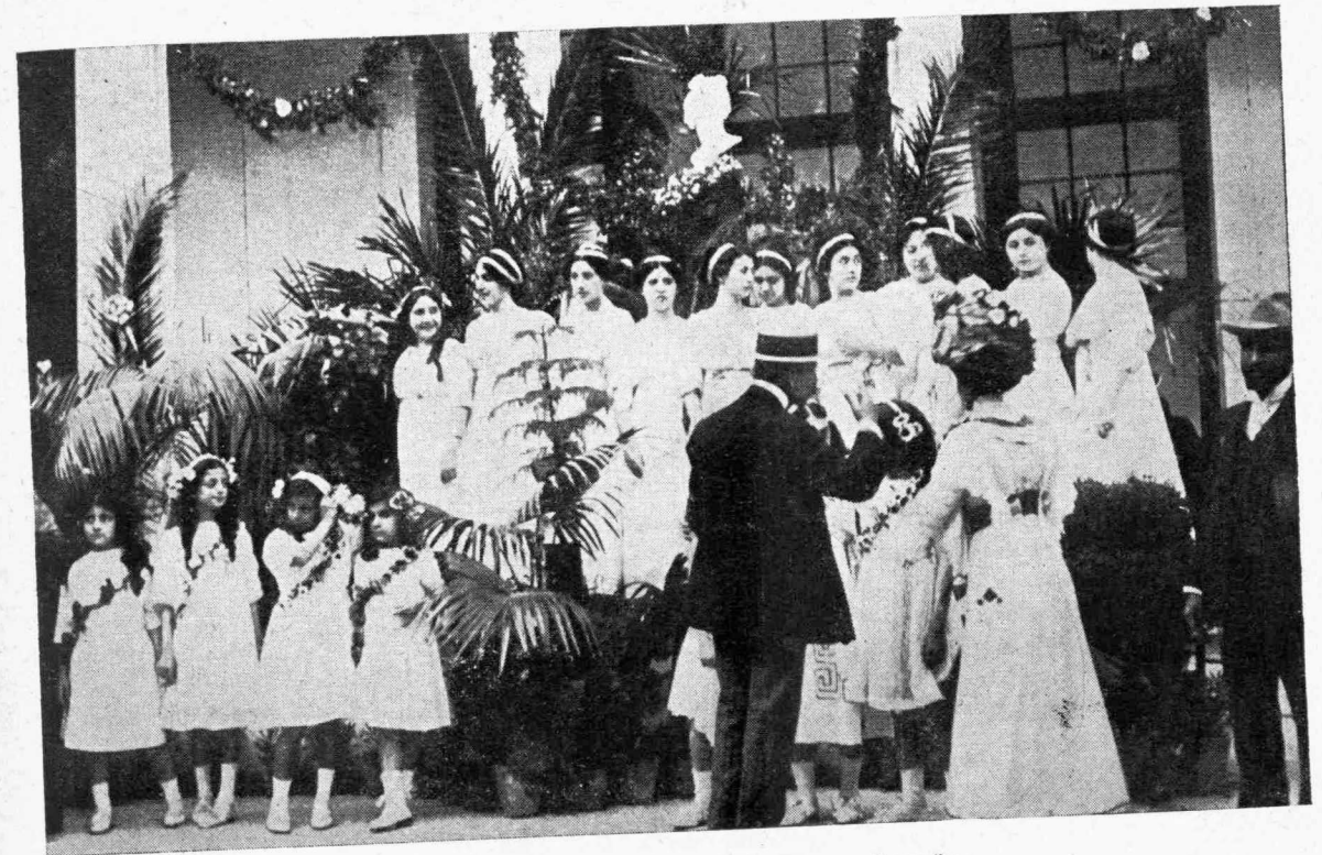
Ἀνθεστήρια. Πρὸ τῆς ἐνάρξεως τῆς ἑορτῆς.