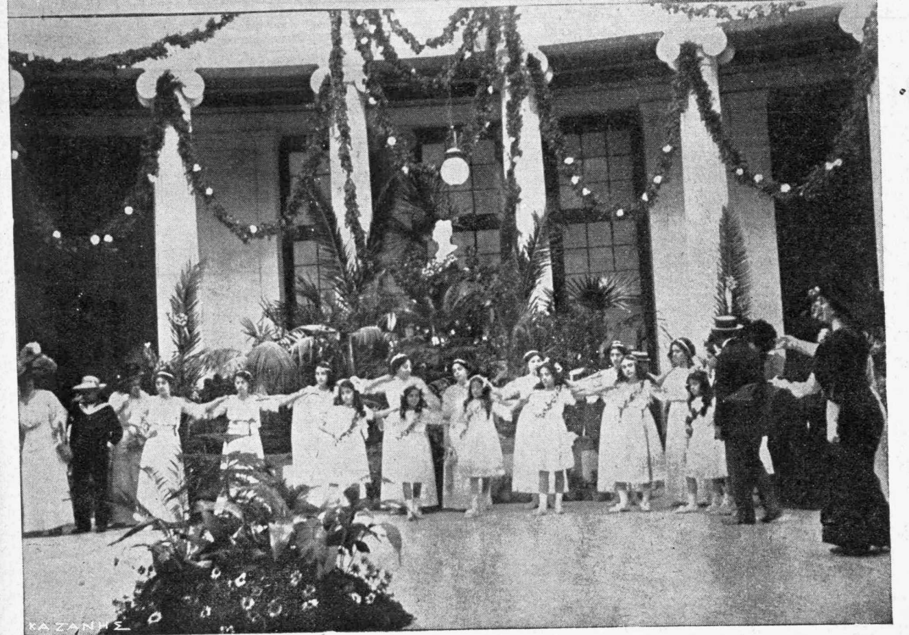
Ἐκ τῶν Ἀνθεστηρίων τοῦ Λυκείου τῶν Ἑλληνίδων.—Ο ΠΕΝΤΟΖΑΛΗΣ