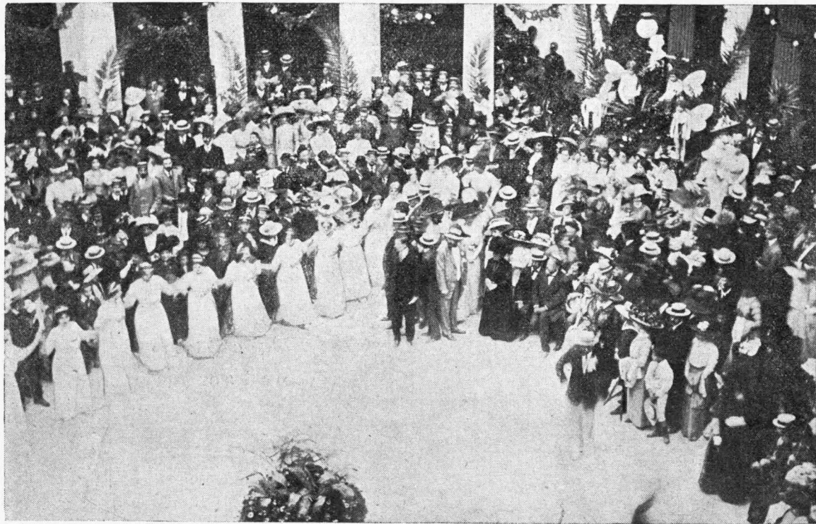
Ἐκ τῶν Ἀνθεστηρίων.