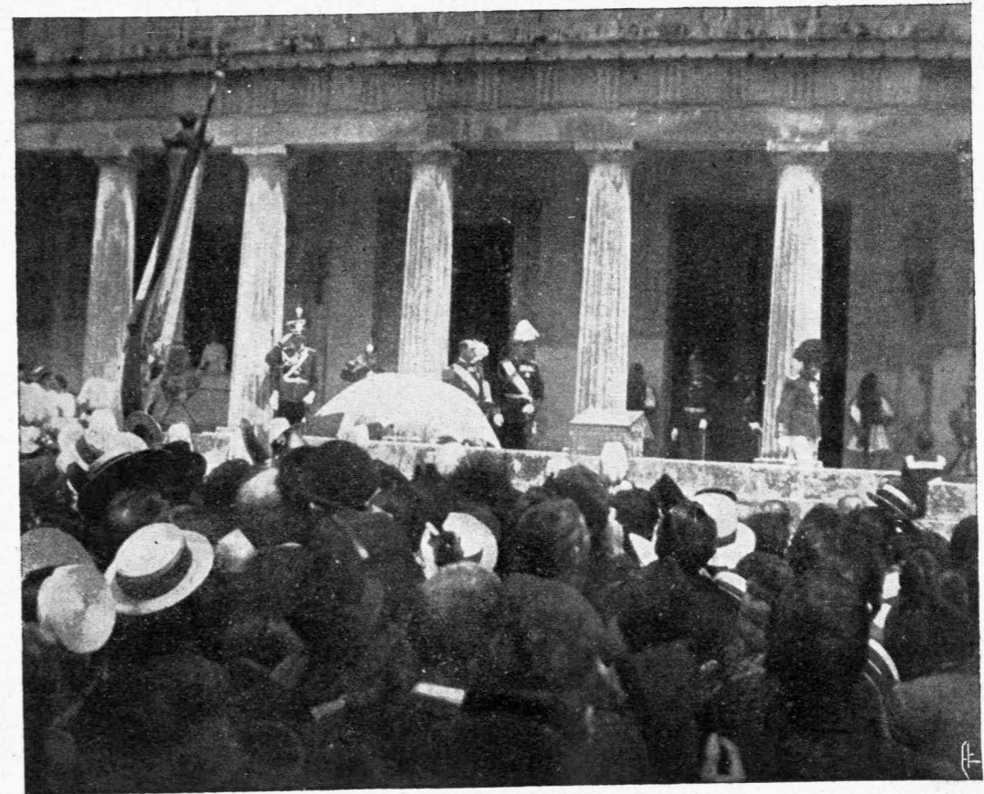
Ὁ Βασιλεὺς μετὰ τοῦ Διαδόχου και τῆς Μ. Δουκίσσης Μαρίας εἰς τὰ προπύλαια τῶν Ἀνακτόρων κατὰ τὴν ἐορτὴν τοῦ Ἁγίου Γεωργίου.

Ζωηροτάτη ὑπῆρξεν ἡ χθεσινὴ συγκέντρωσις εἰς τὸ Ζάππειον, ὅπου ὑπὸ τοῦ «Λυκείου τῶν Ἑλληνίδων» ἐδόθη πρωτοτυπωτάτη ὄντως