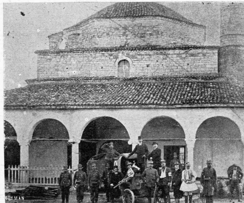
ΤΟ ΤΖΑΜΙ ΤΗΣ ΠΡΕΒΕΖΗΣ

Ἄνοιξε ἢ πόρτα, νὰ ἢ χρυσόπορτα, διάπλατη ἢ πόρτα τῆς ζωῆς, ἴσκιος προσπέρασε θλιμμένος, καὶ τράβηξε ἀργοπατητής. Καὶ τοῦ θανάτου ἢ σιδερόπορτα κι' ἐκεῖνη ὀλάνοιξε μὲ μιᾶς, δεύτερος ἴσκιος πρὸς τὸν πρῶτο σίμωσε, ἢ φλόγα φώτισε τὸ δρόμο του, καὶ τοῦ ἄνοιξε τὸ πέρασμα ὁ βοριάς.