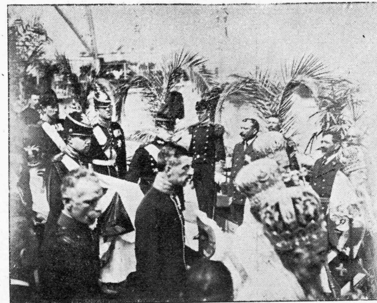
ΑΠΟ ΤΗΝ ΚΗΔΕΙΑΝ ΤΟΥ ΒΑΣΙΛΕΩΣ

Ἡ κουστωδία ἡ ταχθεῖσα νὰ φυλάττῃ τὸν τάφον ἐτέλεσε τὸ καθήκον της, ἀλλ' εἰς μάτην ἵνα πληρωθῇ καὶ πάλιν ἡ ἱερὰ ἐκείνη ρησις λέγουσα: «Μάτην φυλάττεις τὸν τάφον κουστωδία· οὐ γὰρ καθέξει τύμβος Ἄυτοζώϊαν». Καὶ δὲν κατέσχευεν τὴν Ἄυτοζώϊαν τύμβος, καὶ δὲν διεσάλευσεν τὴν Βασιλείαν χρόνος, «πύλαι ἄδου οὐ κατισχύουσιν αὐτῆς» τοῦ· ἐστὶ ἐχθροὶ καὶ μαχηταὶ καὶ ἀντίπαλοι. Πόσαι Βασιλεῖαι ἀνθρώπινοι ἐξηφανίσθησαν