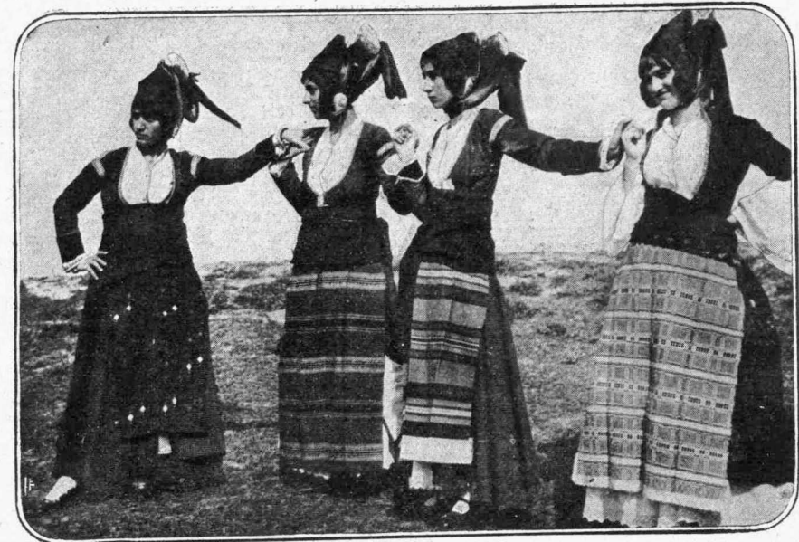
Ἀπὸ τὴν ἐορτὴν τοῦ Σταδίου.—Μακεδονικὴ δμάς

Ἡ χθεσινὴ ἐορτὴ εἰς τὸ Πάλλευκον Παναθηναϊκὸν Στάδιον ὑπῆρξε μία μεγαλειώδης ἀποκάλυψις τῆς ἀθανάτου καὶ πολυμήνου Ἑλληνικῆς εὐμορφίας, τῆς δοξασθείσης ὑπὸ πάντων τῶν αἰώνων, ἠμνηθείσης ὑφ' ὅλων τῶν ποιητῶν καὶ ἐπιγραμματισθείσης χθὲς ἀκόμη ὑπὸ τοῦ Γερμανοῦ Ἀντοκράτορος, φιλοξενηθέντος ἐν Κερκύρα. Ἡ ἀρχαία Ἑλληνικὴ δόξα καὶ ἡ σύγχρονος Ἑλληνικὴ δάφνη συνεκεράνυντο χθὲς εἰς