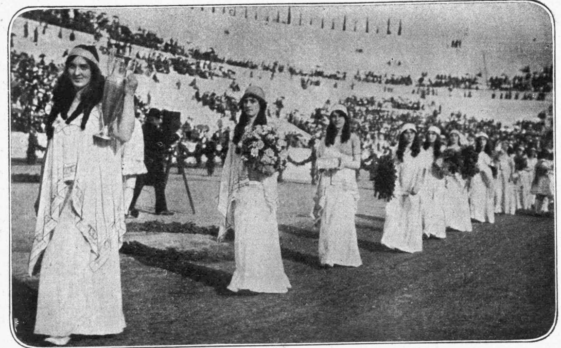
Ἡ Παναθηναϊκὴ παρέλασις εἰς τὸ Στάδιον

Ἐκεῖ ποῦν ἡ ἁγία Σοφία Μὲ τοὺς λόφους τοὺς ἐπτά,