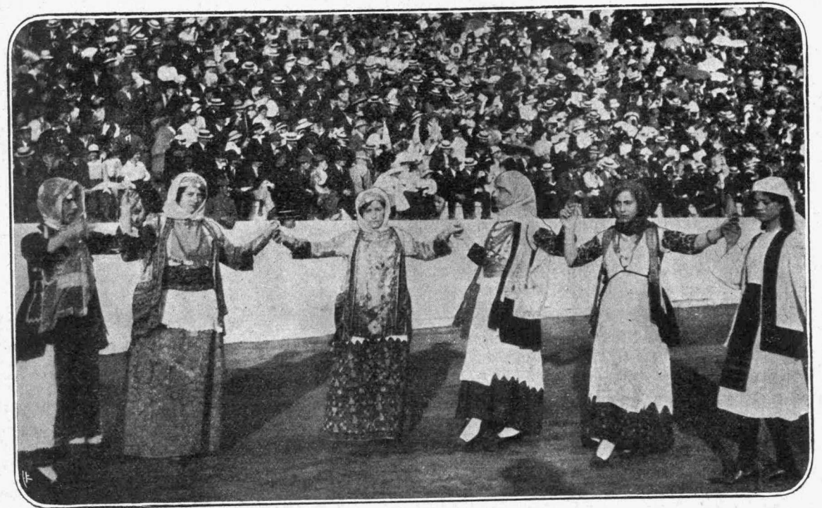
Ἀπὸ τὴν ἑορτὴν τοῦ Σταδίου. — Ὁμάς Ἀττικῆς

Προηγοῦνται πάλιν αἱ ἀθλητρίδες καὶ αἱ καν- νιφόροι, ἔπονται αἱ Σουλιώτισσαι καὶ Ἡπειρώ- τισσαι, ὕστερον αἱ χωρικαὶ τῆς Μακεδονίας καὶ τῆς Κρήτης, ἀκολουθοῦν αἱ νησιώτισσαι καὶ αἱ Ρουμελιώτισσαι καὶ μετ' αὐτὰς αἱ Μωραϊτίσσαι καὶ αἱ Μανιάτισσαι καὶ τελευταῖαι αἱ τῶν Δω- δεκανήσων τῆς Θεσσαλίας καὶ τῶν Ἰονίων νή- σων.