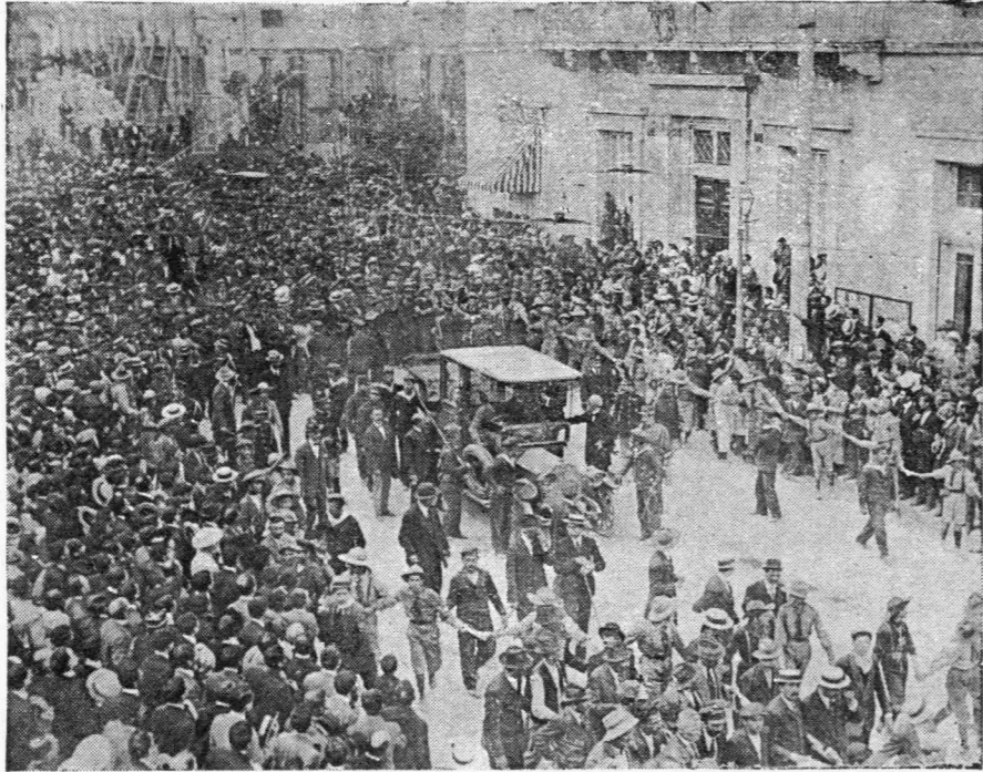
Ἡ μεταφορά τῆς εἰκόνης τῆς ΕΥΑΓΓΕΛΙΣΤΡΙΑΣ ἀπὸ τὸν ναόν.