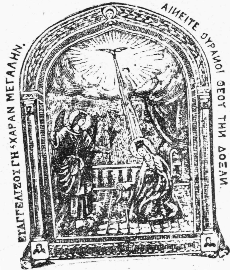
Ἡ ΘΑΥΜΑΤΟΥΡΓΟΣ ΕΙΚΩΝ ΤΗΣ ΕΥΑΓΓΕΛΙΣΤΡΙΑΣ ΤΗΣ ΤΗΝΟΥ

Ἡ Παναγία ἐφθασε. Ἡ ζωικὴ δύναμις ἐνὸς ὀλοκλήρου λαοῦ τὴν ἐμφυχώνει, τὴν ζωτανεύει παρὰ τὸ προσκεφάλαιον τοῦ μεγάλου Ἀσθενοῦς. Τὰ μυρία ἀόρατα μόρια τῆς ζωῆς, εἰς ὄργασμὸν ἀναγεννήσεως πυκνώνουν τὴν γύρω του ἀτμοσφαῖραν. Τὰ θαῦμα συντελεῖται. Ἡ πίστις καὶ ἡ ἀγάπη τοῦ λαοῦ Σου Σὲ ἔσωσε, Βασιλεῦ!