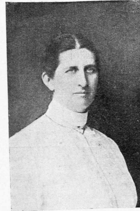
Ἡ κ. ΧΑΡΙΚΛΕΙΑ ΜΠΑΛΤΑΤΖΗ

Ἡ Βασίλισσα Σοφία πρὸ δέκα ὀκτὼ περίπου χρόνων ὡς Πριγκίπισσα τότε ἐτέθη ἐπὶ κεφαλῆς ὁμάδος κυριῶν διὰ τὴν ἴδρυσιν καὶ λειτουργίαν εἰς Ἀθήνας Οἰκονομικῶν Συσσιτίων. Μὲ τὴν ἐνεργητικότητά δὲ, ἡ ὁποία τὴν διακρίνει, κἀτώρθωσε τὴν ἴδρυσιν δύο Συσσιτίων, τὰ ὁποῖα λειτουργοῦν ἐπὶ δέκα ὀκτὼ ἤδη ἔτη μὲ τοιαύτην τάξιν, καθαριότητα καὶ ἐντέλειαν, ὥστε νὰ ἀποτελοῦν πρότυπα τελειότητος. Χιλιάδες ὅλα