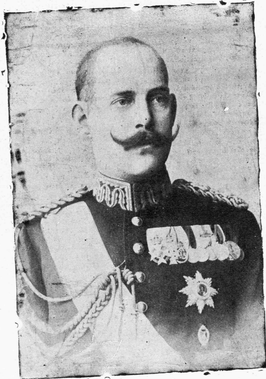
Ο ΜΕΓΑΣ ΑΣΘΕΝΗΣ

— Ἐμπρός! κάτω γλήγωρα, ἐφώναξεν ἡ κερὰ Μαρριγώ. Νὰ σᾶς δώσω νὰ φάτε πρὶν νὰ γυρίσῃ, γιὰτὶ ἀλλοίμονό σας, ἂν δὲ σᾶς εὖρη κοιμηθῆτε. Ὅλα ἔτρεξαν κάτω καὶ μόνον ἡ Ἄννα ἔμεινε κοντὰ εἰς τὴν μητέρα της. Ὅλα ἔφαγαν γλήγωρα καὶ φοβισμένα, μὲ τὸ νοῦ