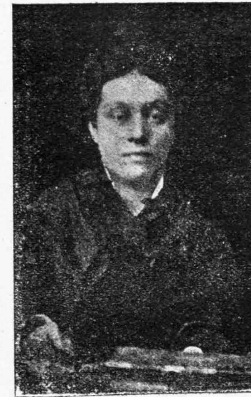
Η ΣΑΠΦΩ ΛΕΟΝΤΙΑΣ

Τὸ ταξεῖδι τοῦ γάμου μου, μοῦ εἶχε δώσει τὴν εὐκαιρίαν νὰ ἰδῶ καὶ νὰ γνωρίσω γυναῖκας, αἱ ὁποῖαι εἶχαν ζήσει τὴν μακρὰν ζωὴν τῶν χωρὶς παιδιὰ καὶ χωρὶς καμμίαν ἄλλην ἀσχολίαν. Τὰ σπιτία τῶν ψυχρὰ σὰν ἄδης μεθ' ὅλα τὰ πολῦτιμα ἐπιπλά καὶ τὴν ἀπαστράπτουσαν καθυπερβολικότητα. Καὶ τὰ αἰσθητά τῶν ἐπίσης. Ἐγώστρικα αὐταῖ, ἐγώστρικα οἱ ἄνδρες τῶν, ἐχάνοντο δι' ἕνα τίποτε καὶ ἐζοῦσαν ζωὴν ἀχρωμάτιστον, ὁσάκις δὲν τὴν ἐπαρὰχρωμάτιζαν μὲ σκάνδαλα, εἰς τὰ