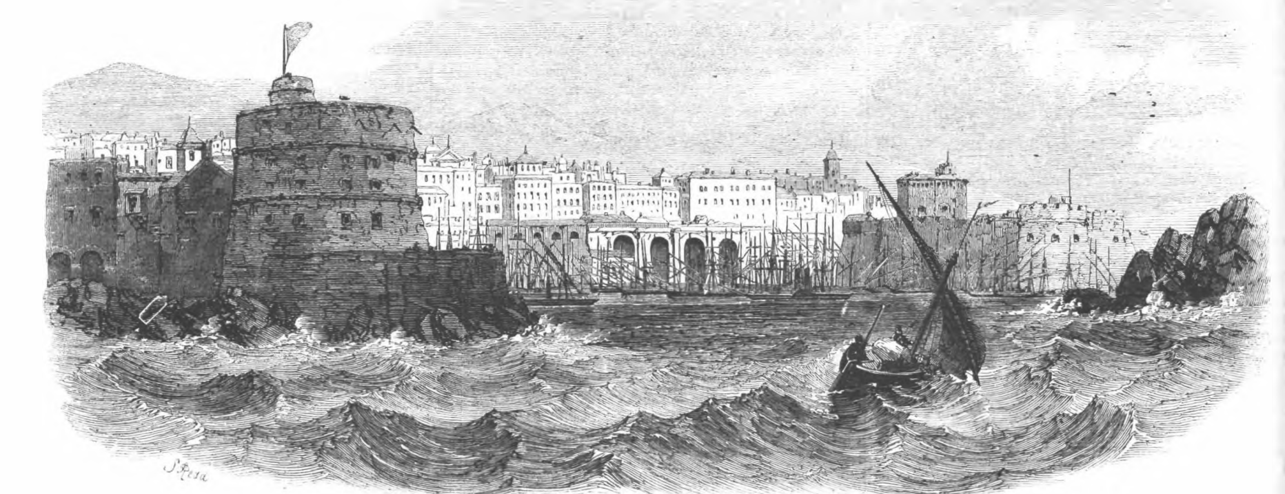
ΣΙΒΤΑ ΛΕΚΚΙΑ. (102 πλ. 96.)

— Οὐτε δικά λεπτῶν ἀπόστασις. — Ἄς ὑπάγωμεν λοιπὸν ἐκεῖ κάλλιον παρὰ νὰ πε- ριμερωμεν ἐνταῦθα. Ὁ Ἀλῆς ἠγέρθη καὶ πάλιν μετ' ἀδιαφορίας. Εἶχε μὲν δώσει τὸν λόγον του νὰ ἐπισκεφθῇ τὴν ἀσθενή- νὰ κατὰ τὴν προτεραιάν, ὡς ἐνθυμώμεθα, ἀλλ' ὑπεσχεθῆ νὰ πρῆξῃ τούτο ἐπ' ἐλπίδι νὰ μαθῇ παρὰ τοῦ Μαυρο- βουνιώτου τὸ καταφύγιον τοῦ Χριστοῦ Μιλλιῶνι εἰς τὸν Τύμαρον, ὅπως πληροφορηθῇ ἐκεῖθεν περὶ τῆς τύ- χης τῆς μητρὸς καὶ ἀδελφῆς του. Νῦν δὲ ὅτε ἐγνώρι-