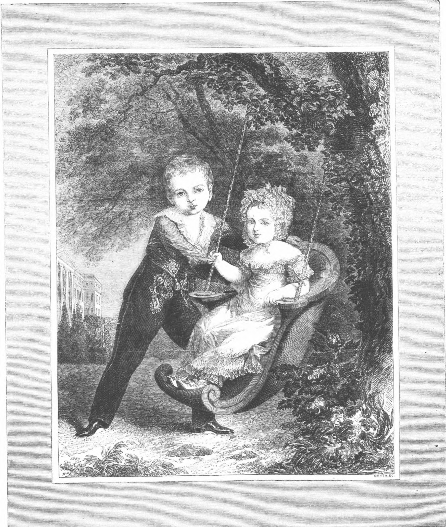
Ο ΑΥΤΟΚΡΑΤΩΡ ΤΩΝ ΡΩΣΙΩΝ ΑΛΕΞΑΝΔΡΟΣ Ο Β' ΚΑΙ Η ΔΕΛΦΙΝΗ ΑΥΤΟΥ ΜΑΡΙΑ ΝΙΚΟΛΑΕΒΝΑ ΕΠΙ ΤΗΣ ΠΑΙΔΙΚΗΣ ΑΥΤΩΝ ΠΑΙΚΙΑΣ. (ΑΣΤΗΡΟΛΟΓΙΟΝ ΤΗΣ ΡΩΣΙΚΗΣ, ΕΚΔΟΘΕΝΤΗΣ ΕΝ ΠΕΤΡΟΥΠΟΛΕΙ.)

— Ἐπεὶ αὐταὶ ἦσαν εἰς χεῖρας τῶν Γαρδικιωτῶν, οὕτε διὰ τὴν ὑποσχέσιν του, οὕτε διὰ τὴν δαιμονιομένην ἐφρόντιζεν. Ὁ Μαυροβουνιώτης ἐπερίμενε μετ' ἀνπομοιησίας ὀλόκληρον τὴν ἡμέραν εἰς τὴν θύραν τοῦ οἴκηματος, ὅτε ἴδων τούτους προσερχομένους ἔτρεξεν εἰς συνάντη- σίν του καὶ μετῴνους τοὺς προσεκάλεσε νὰ τὸν ἀκολου- θήσωσιν. Ἦ κατοικία, ἡ μᾶλλον εἰσαίτη, ἡ καλύβη ἐκείνην ἐπέκειτο ἐν σκίτῳ, ὅτε εἰσῆλθον οὐκ ἐν τῶν ἐν αὐτῇ ἀντικειμένων ἡδυνάτο νὰ διακρίνωσιν. Ὁ Μαυ- ροβουνιώτης ἐκάλεσεν ἐξ ὀνόματος εἰς τὴν πᾶσχοσαν εἰὰ νὰ πλησιάσῃ. ἀλλ' οὐδ' ἀπάντησιν κἂν ἔλαβεν. — Εἶχε χάρις νὰ τὴν ἔπασσε πάλιν τὸ κακὸ· τρεῖς φοραὶς ἔπειτα σήμερον χαμῶ εἶπεν ὁ Μαυροβουνιώτης καὶ ἔσπευσε ν' ἀναψῆ τὸν λυχνον. Ἡ Ζιδρὲ προχωρήσας μετὰ τοῦ Ἀλῆ εἰς τὸ βάθος τῆς καλύβης· ὅταν ἐκ ὁ Μαυροβουνιώτης ἐπλησίασε