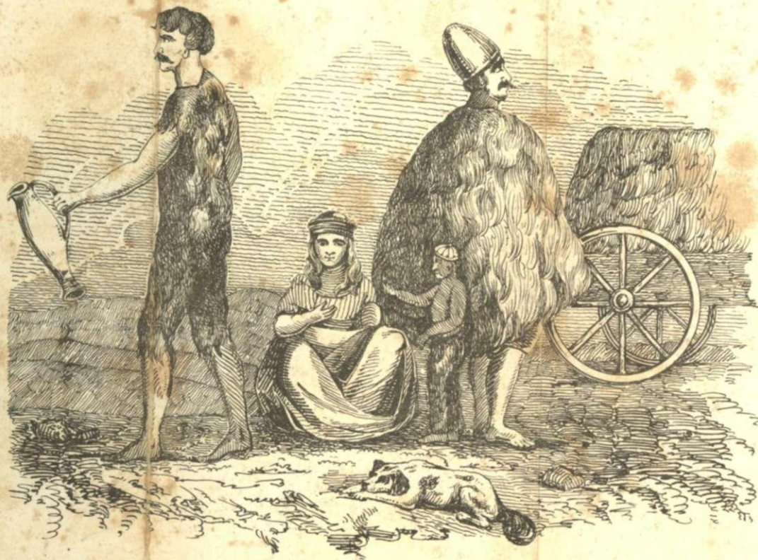
ΚΑΤΟΙΚΟΙ ΤΩΝ ΕΡΗΜΙΩΝ ΤΗΣ ΑΣΙΑΤΙΚΗΣ ΤΑΡΤΑΡΙΑΣ .