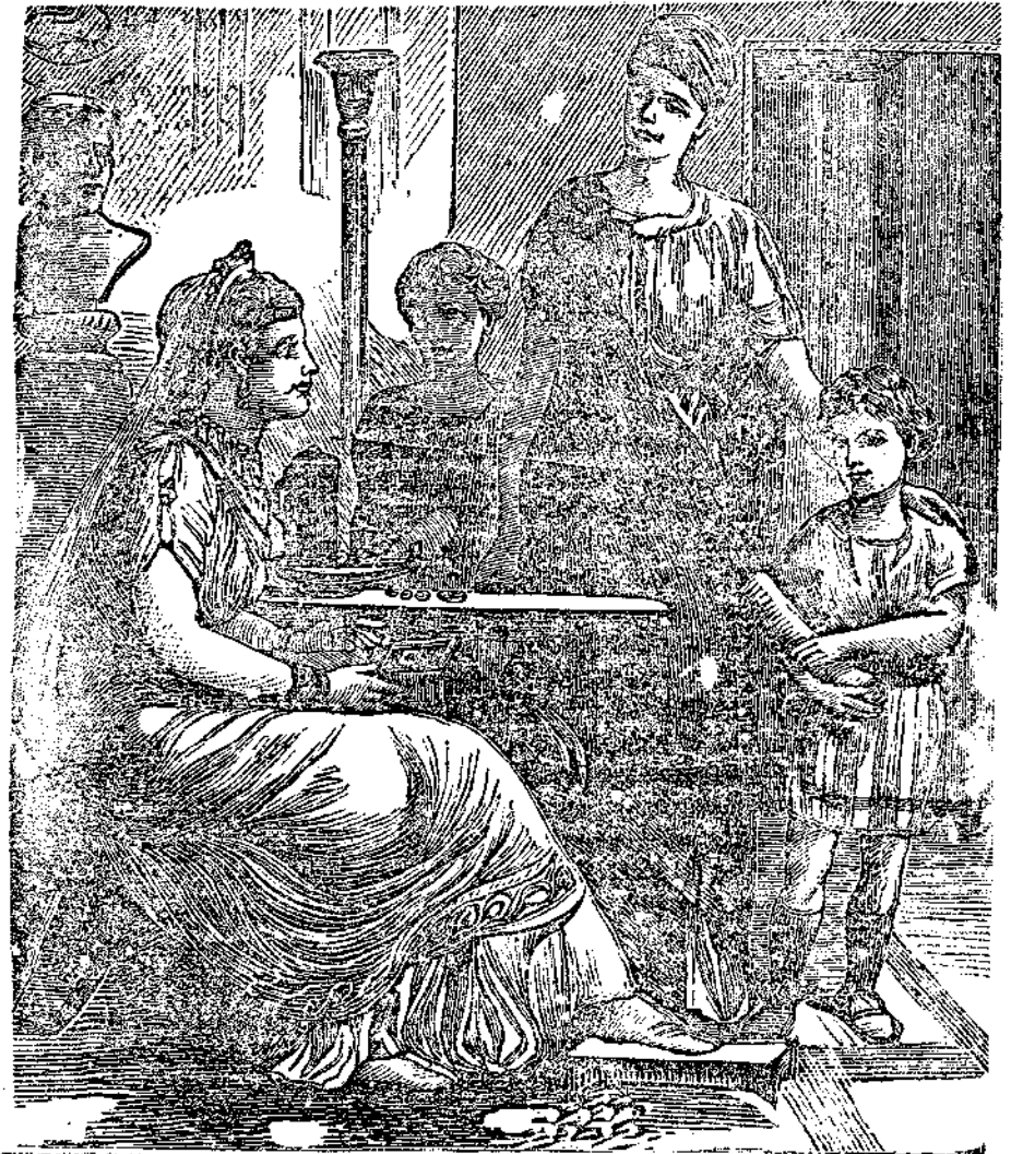
Τά κοσμηματα της Κοραφίασ