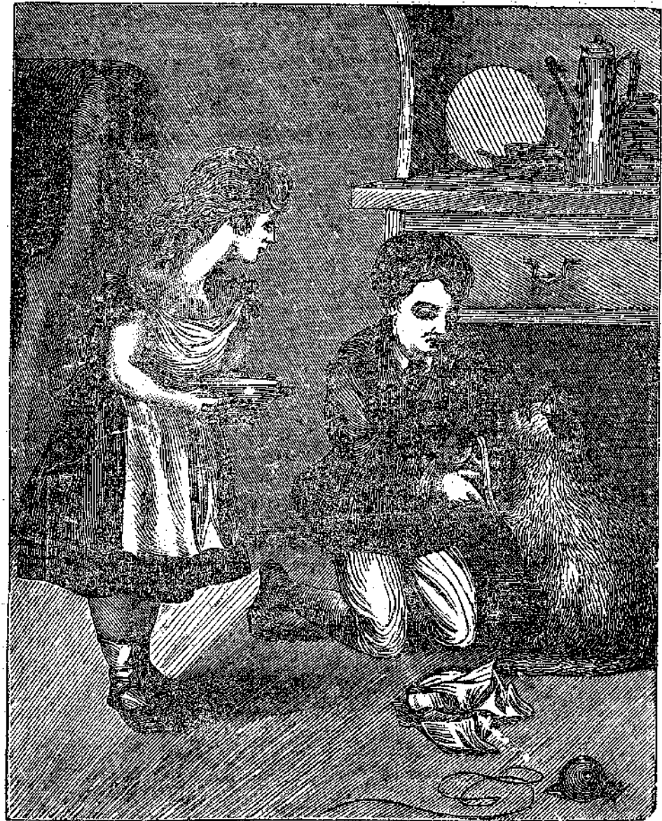
Οἱ φίλοι τῆς Λιαίνας.

Σπαραξέκκερδοιοι θρηνοὶ τοῦ ἀτυχῶς ζῶου συνεκίνησαν μεχρι δακρυῶν τὸν κκλὸν Λυκοῦργον. Ἡ δὲ Εὐανθία καὶ ἡ