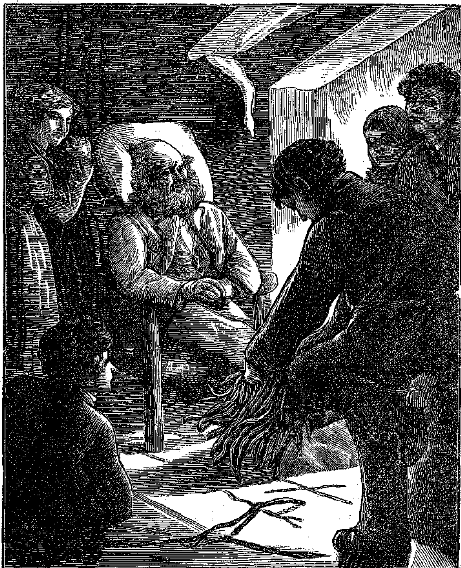
Ἡ ἰσχὺς ἐν τῇ ἐνώσει